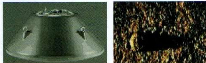
Figura 1 – Mina Manta e sua imagem sonar

A figura 1 mostra uma mina de fundo Manta , de fabricação italiana, uma das mais modernas da atualidade, e uma imagem sua obtida pelo sonar de um navio caça-minas (NCM).