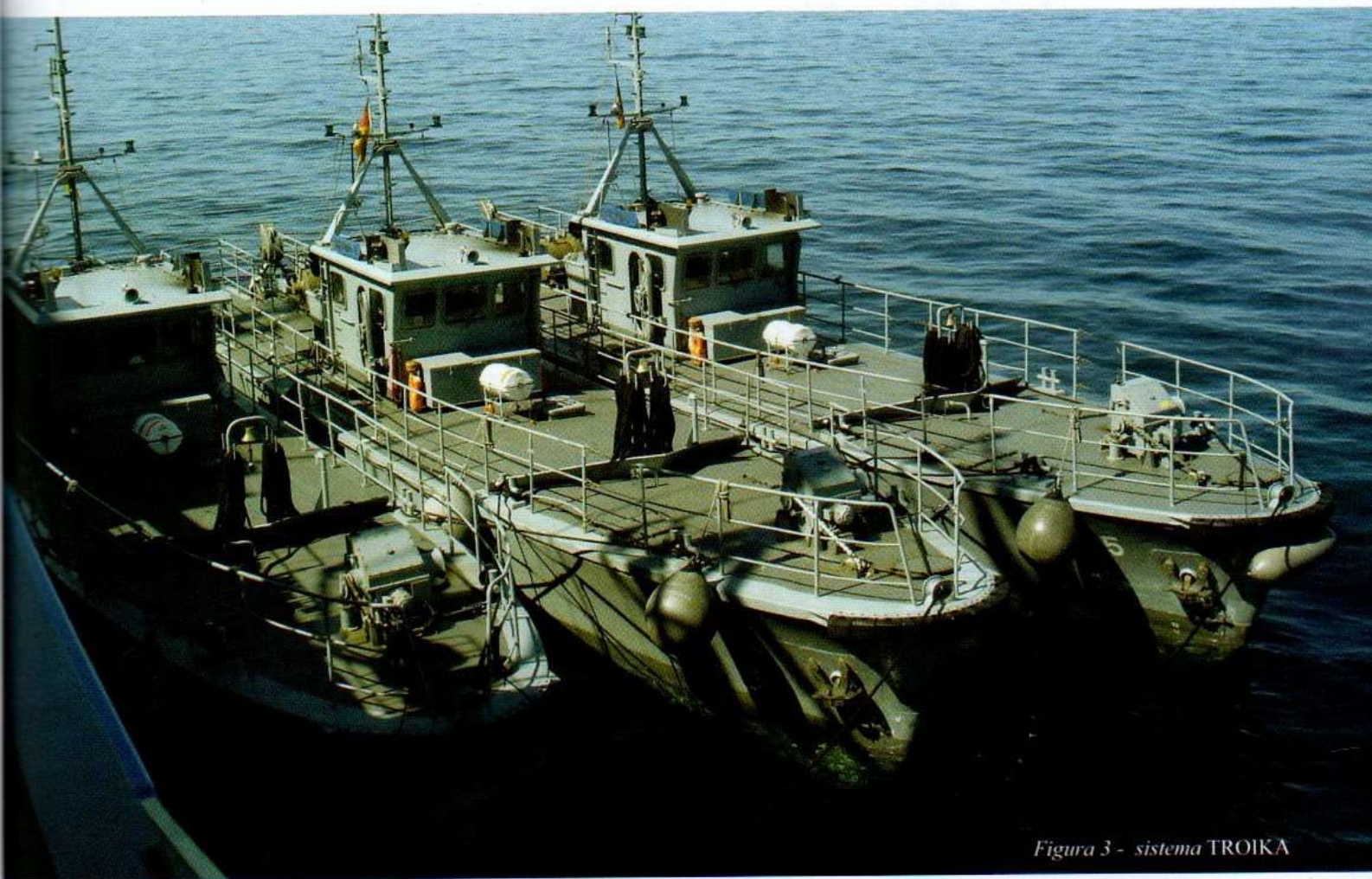
Figura 3 - sistema TROIKA

Certamente, a necessidade premente de uma Força de CMM adequada não fica restrita à MB. No Brasil, aproximadamente 95% do comércio exterior (importações e exportações) do país ocorre por via marítima, utilizando os diversos portos nacionais, cujo valor deve alcançar, no corrente ano, US$ 170 bilhões. Da Plataforma Continental, extraímos aproximadamente 88% da nossa produção de petróleo, cerca de 2 milhões de barris/dia o que, a preços conservadores, é coisa da ordem de US$ 2 bilhões por mês 2 . A manutenção da liberdade do trânsito nos portos nacionais e nas bacias petrolíferas é vital para o crescimento econômico, e uma interrupção no trânsito de embarcações nestas áreas representaria vultosas perdas financeiras, debilitando a economia do país.