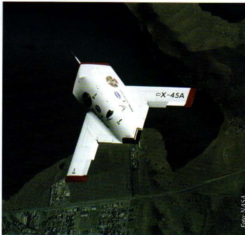
Vôo de teste do UCAV X-45A sobre a Base Aérea de Edwards, Califórnia.

- Veículo grande - diâmetro maior que 91cm, autonomia de até uma semana, raio de ação de 100 milhas e peso máximo de 10 toneladas. Alguns veículos poderão possuir um diâmetro de 183cm e serem lançados de tubos de lançamento vertical dos submarinos nucleares norte-americanos. Serão empregados em busca, reconhecimento, guerra anti-submarino, minagem, operações especiais e ataque.