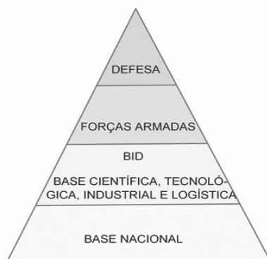
Figura 1 – Pirâmide de Defesa

O terceiro bloco apresenta a “base científica, tecnológica, industrial e logística, nacional, de defesa (BID)”, suporte das forças combatentes em termos de conhecimentos, sistemas, equipamentos, materiais, serviços e tecnologia. O quarto bloco representa a “base nacional”, sustento de toda a estrutura de defesa, provedora dos recursos básicos, tanto humanos como tecnológicos e industriais de base (siderurgia, metalurgia, bens de capital, mecânica, eletrônica, material de transporte, química, telecomunicações, ou seja, a infra-estrutura nacional).