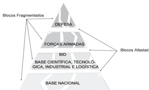
Figura 2 - Pirâmide de Defesa com Blocos Afastados e Fragmentados

Finalmente, os blocos atuais estão fragmentados, revelando a falta de conjunto e a dificuldade de relacionamento entre seus próprios elementos. Por exemplo: os órgãos do Governo, as comissões do Congresso e os centros acadêmicos aparentam ter visões distintas sobre defesa; a Marinha, o Exército e a Aeronáutica ainda sustentam seu passado de independência; e o entendimento entre alguns elementos da BID, como as universidades, os centros de pesquisa e as áreas industriais, precisa ser aperfeiçoado.