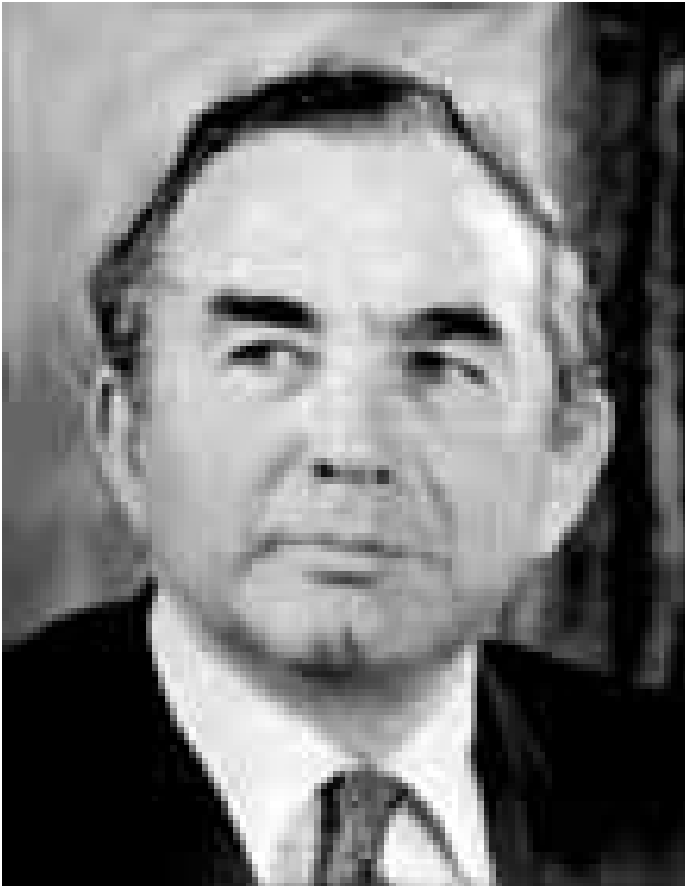
Governador Rex Hunt

“Quando fui nomeado como governador, o secretário geral disse que as Falklands eram um lugar tranquilo e cativante. Não havia nada tranquilo em 1982.” (Sir Rex Hunt, Governador das Ilhas Falklands/Malvinas).