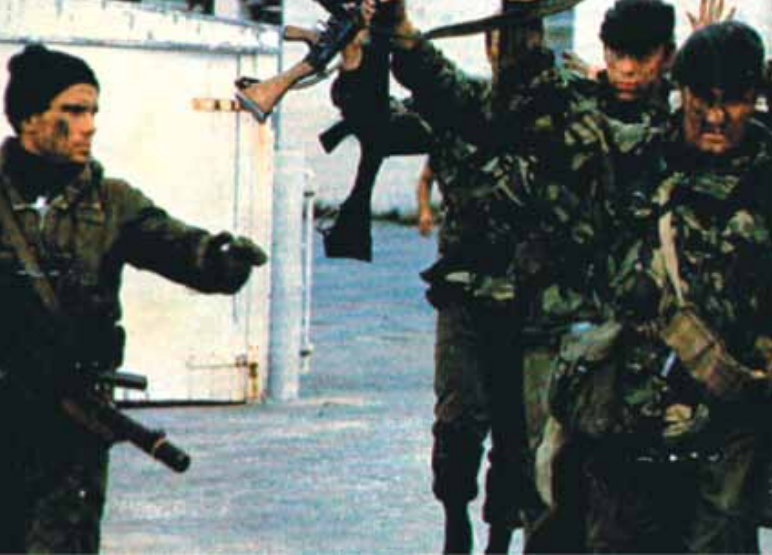
Comando da Marinha Argentina rendendo soldados ingleses.