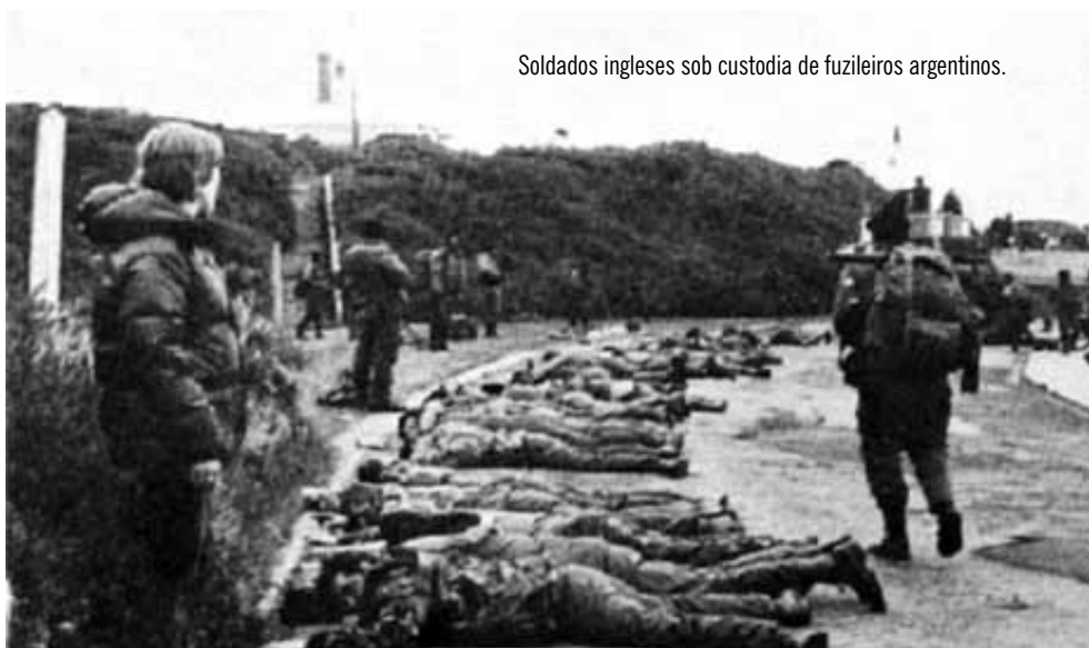
Soldados ingleses sob custódia de fuzileiros argentinos.

Com a aproximação de veículos anfíbios e do Batalhão de Infantaria Marinha nº 2, o governador Hunt, acompanhado dos majores Norman e Noott, decide iniciar conversações para um cessar-fogo. O Contra-Almirante (FN) Busser, comandante das forças terrestres, chega para iniciar negociações com o governador ordenando a viva voz cessar fogo aos seus homens. O gover-