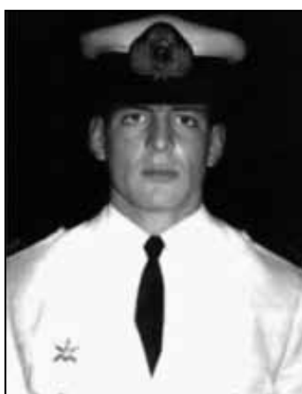
Comandante Pedro Giachino

A missão estava cumprida: as ilhas estavam sob controle argentino.