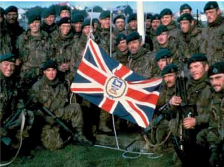
Royal Marines que participaram dos combates de 2 de abril de 1982.

Os fuzileiros britânicos, que estavam no posto de observação de Sapper Hill, informaram ao Major Norman sobre o ruído de motores. O comandante britânico julgou ser a movimentação de helicópteros inimigos, quando na verdade eram 19 botes “zodiacs” encaminhando-se para a praia. Ao alcançarem terra, os argentinos ocultaram os botes e desejaram “buena suerte” a cada um dos seus companheiros. Às 23:45, rumaram para seus objetivos.