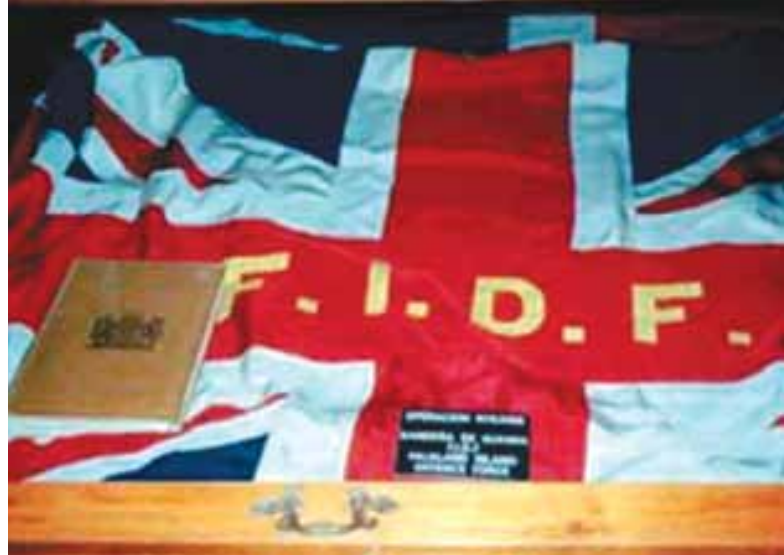
Bandeira britânica capturada.

nador cumprimenta o almirante dizendo: “Isto é propriedade britânica. Você não foi convidado.” Ao final da reunião fica decidida a rendição das tropas inglesas.