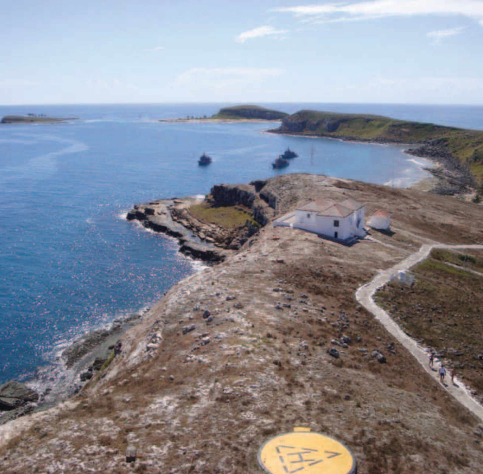
Avisos de Instrução no Arquipélago de Abrolhos

porto movimenta, quanto aos fundeadouros e até mesmo dados de Ponto de Maior Aproximação (PMA).