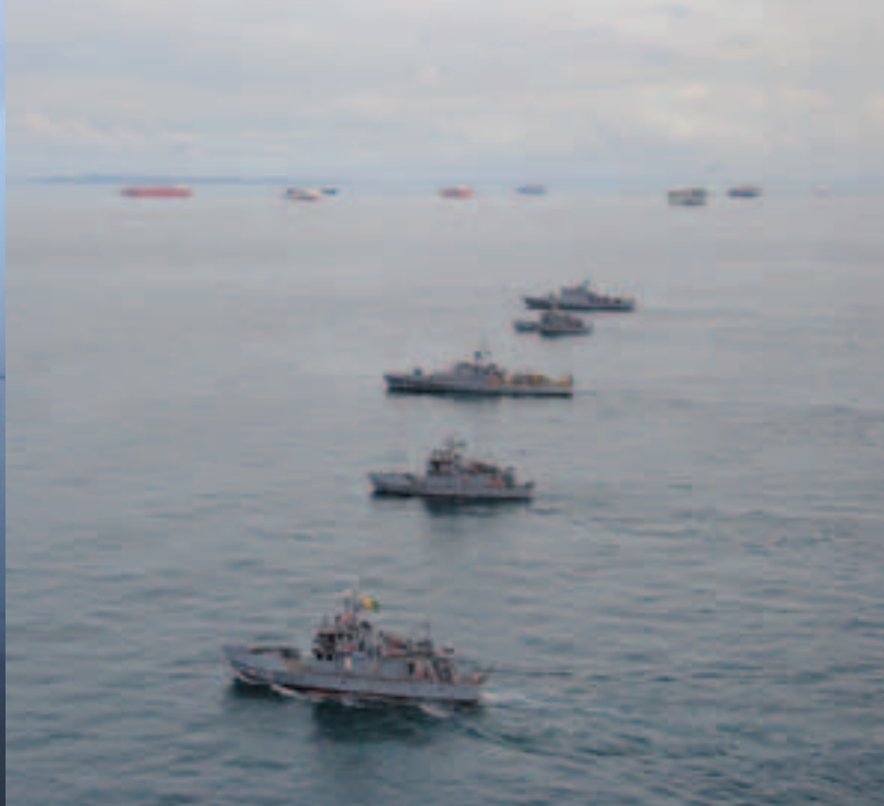
Aviso de Instrução atracados em Paquetá e em operação com Navios Varredores