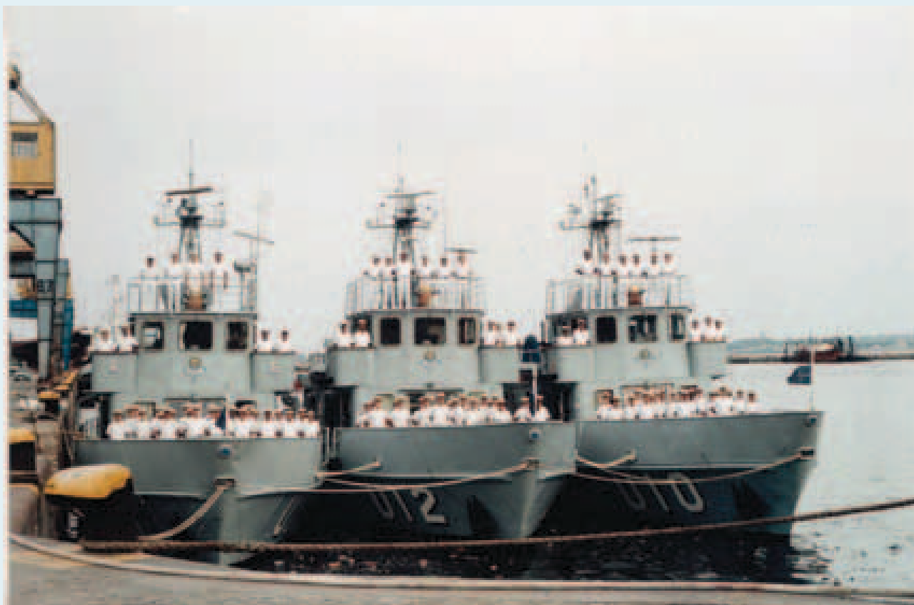
Navios atracados no Porto de Montevideo

A utilização do AIS e do SeaClear permite aos Aspirantes, por exemplo, confirmar as informações da publicação Roteiro, quanto ao tipo de carga que um