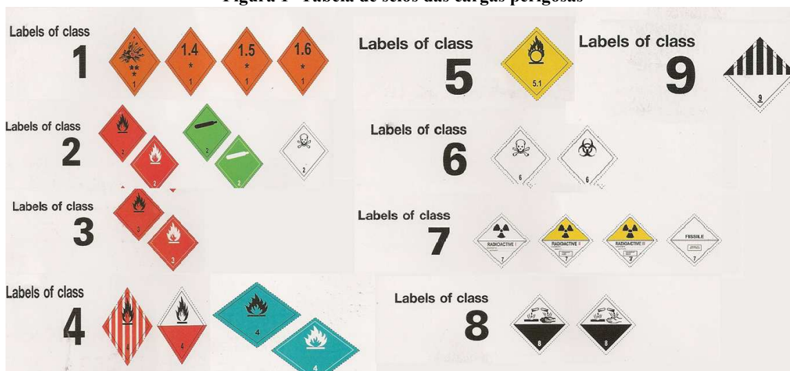
Figura 1- Tabela de selos das cargas perigosas

Outro ponto importante a ser destacado em relação a embalagem é a necessidade de constar na mesma etiquetas, rótulos, marcas para a informação de quem manuseia a carga evitando assim acidentes. Também deve-se lembrar da necessidade de fazer cópias do plano de carga perigosa e distribuir e afixar em locais visíveis e frequentados pelos tripulantes e estivadores, a fim de possibilitar que esses se familiarizem com o local da estivagem e com os detalhes da carga perigosa transportada, evitando assim possíveis acidentes. Recomenda-se, ainda, informar à tripulação sobre as medidas a serem tomadas em caso de acidentes (derrame, vazamentos, etc).