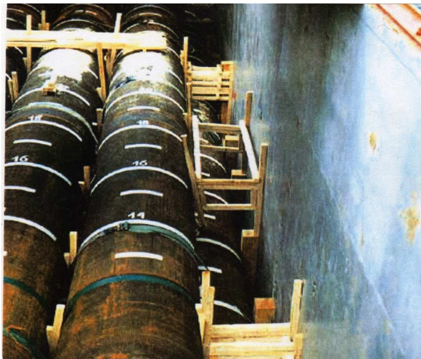
Figura 6- Escoramento de tubos

O escoramento da carga geral não é uma faina qualquer.É de suma importância e exige cuidados e técnicas que devem ser seguidas.