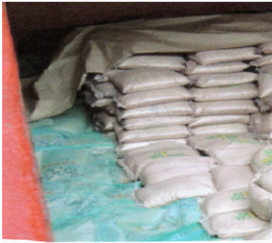
Figura 4- Avaria causada devido a mistura da carga

7) Carga Alimentícia – Este tipo de carga requer estivação mais cuidadosa, para evitar contaminação por outras mercadorias, principalmente às venenosas.