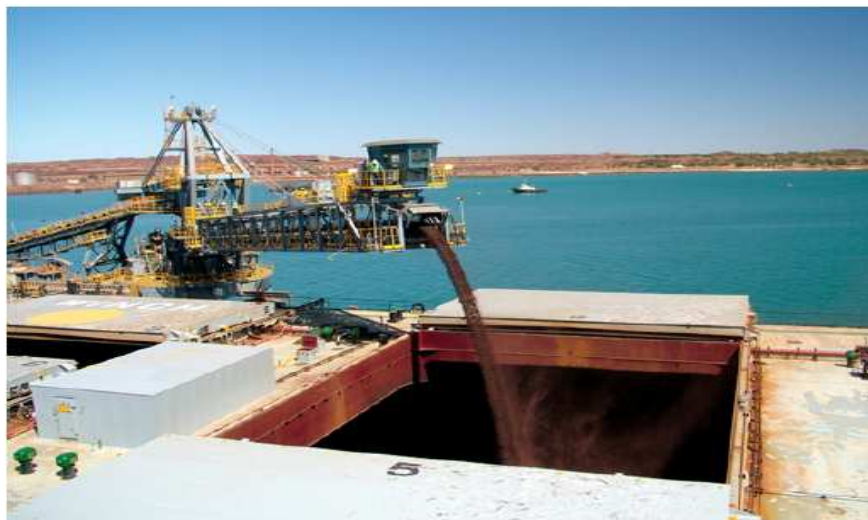
Figura 5: Shiploader

Shiploader , é também chamado de carregador de navios. Ele possui uma capacidade variada para embarque de cargas a granel sólidas, sai diretamente do terminal, onde está armazenado, e vai direto para o porão onde será armazenado.