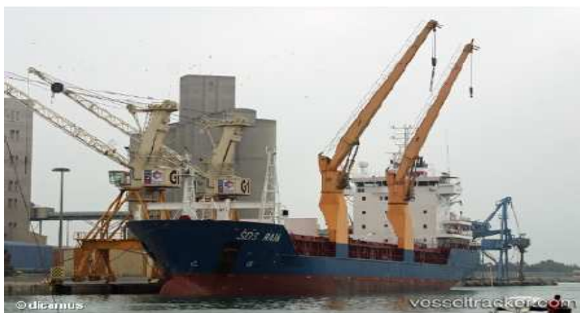
Figura 4: Pau - de - Carga Singelo Oscilante

Pau - de - Carga Singelo Oscilante é um guindaste próprio para embarque e desembarque de cargas.