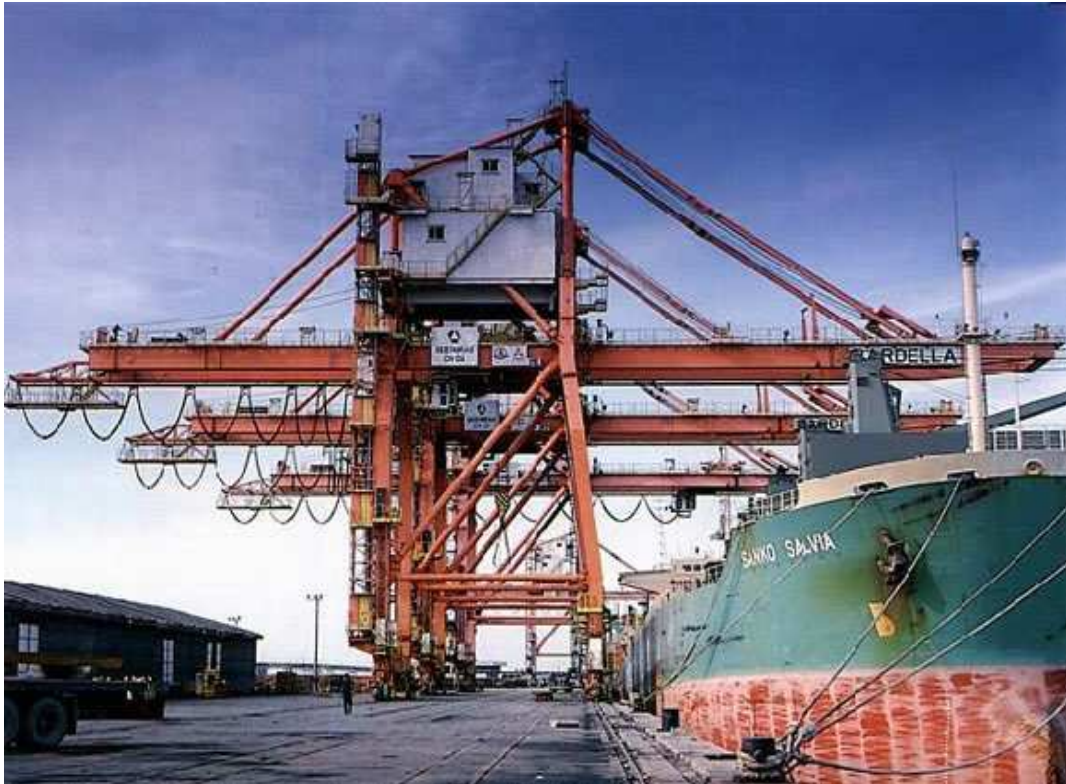
Figura 7: Transtêiner

Os Transtêineres são equipamentos que içam o contêiner no terminal e o transfere para o navio, de forma contrária, içando do navio e transferindo para o terminal em caso de descarga.