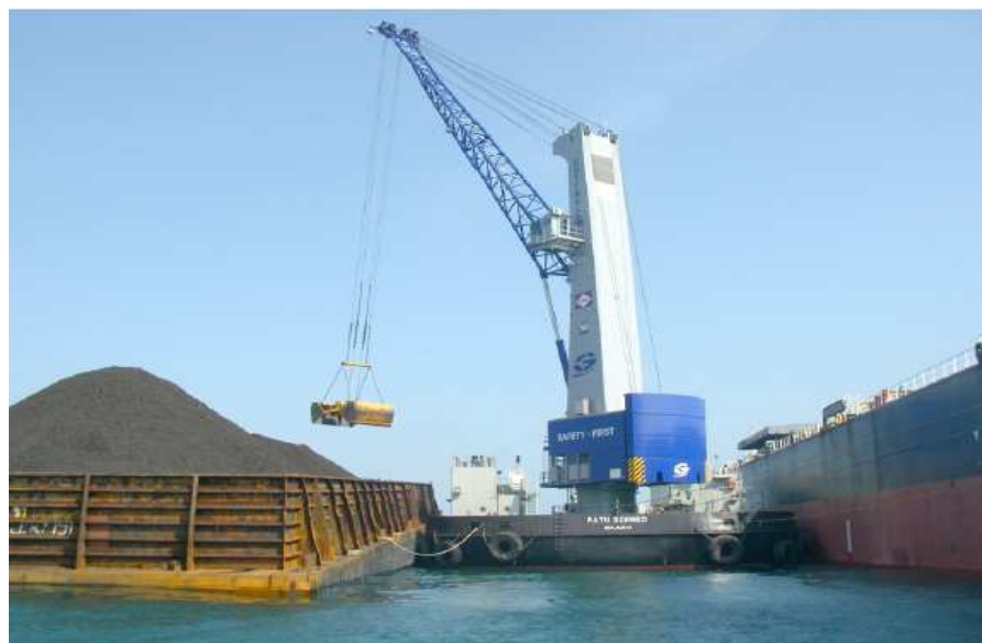
Figura 3: Cábrea Flutuante

A Cábrea Flutuante ou Super Guindaste pode operar ao lado do costado do navio, ao lado do cais, ao lado do estaleiro ou ao lado da plataforma petrolífera. A cábrea é considerada um super guindaste, pois foi projetada para fazer o carregamento de cargas muito pesadas, que os guindastes comuns não suportariam.