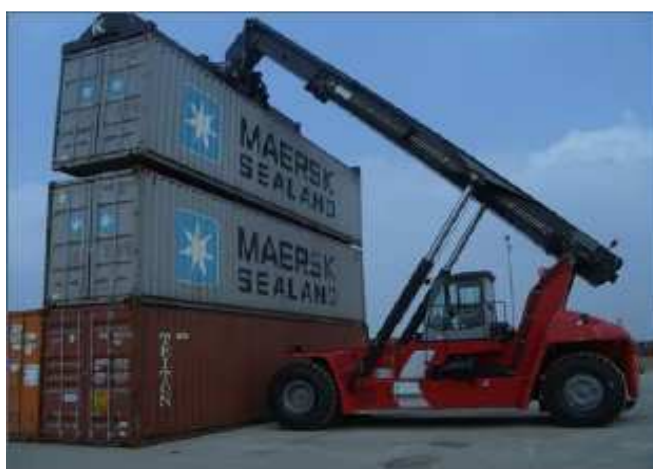
Figura 6: Empilhadeira

As empilhadeiras para contêineres são equipamentos que servem para organizar e dispor o contêiner no pátio.