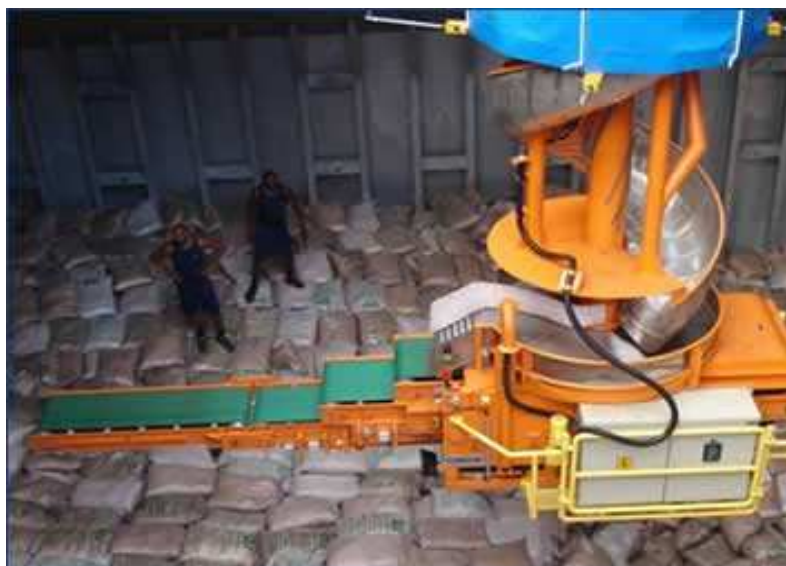
Figura 2: Carregador espiral de sacos

Em carga geral, pode-se citar alguns equipamentos que auxiliam o carregamento, aumentando, assim, a velocidade de embarque dessas cargas e minimizando o tempo de estadia nos portos, como por exemplo, o carregador espiral que possui uma capacidade de carregar três mil sacos por hora, e permite o carregamento sem a movimentação do navio, pois ele acessa todos os pontos da embarcação.