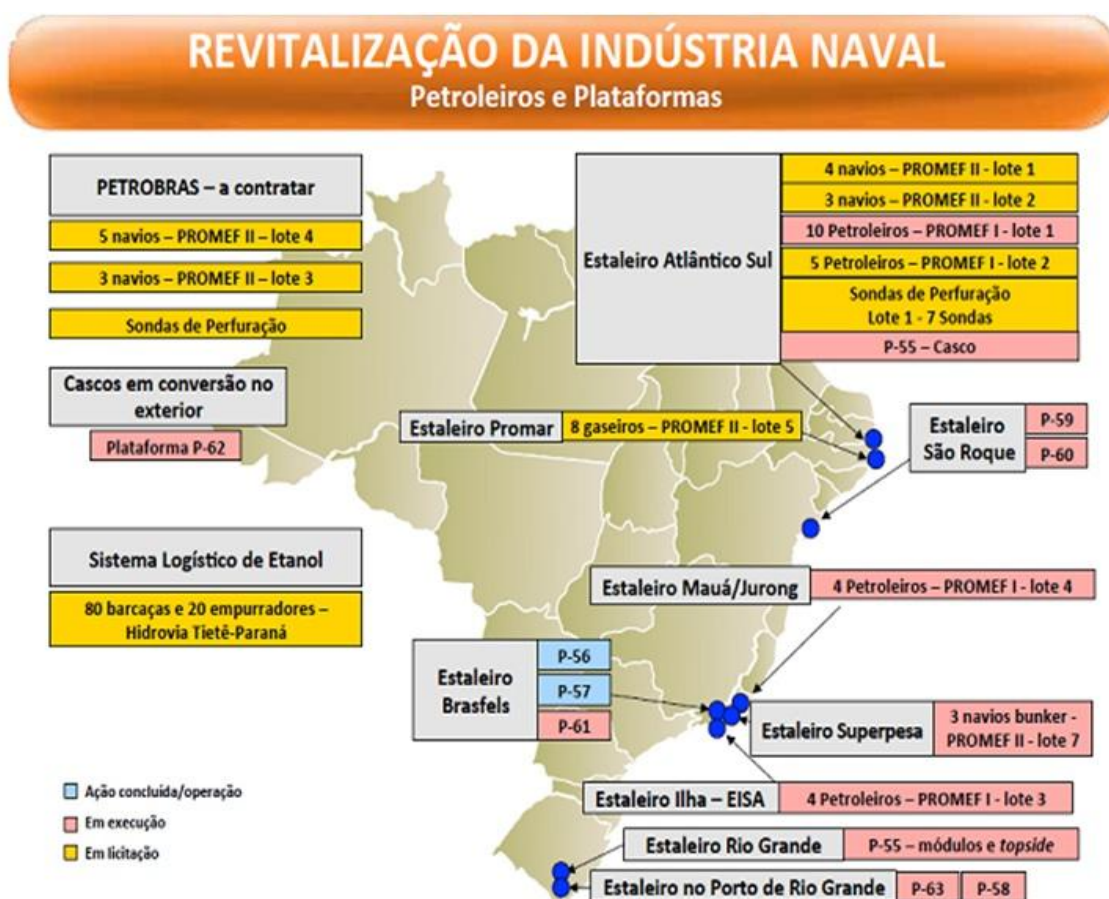
Figura 3 - Cronograma PROMEF