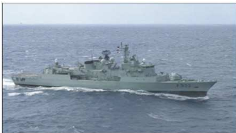
O navio chefe da SNMG1

A SNMG1 tem sido normalmente empregue nas áreas do Atlântico e do Mediterrâneo, nas mais diversas missões e nos mais variados cenários de atuação, quer em situações de paz, quer de crise e conflito. É a primeira vez que esta força está destacada nas regiões do "Corno de África" e do sudeste Asiático, o que vem demonstrar a importância que a NATO está a atribuir ao combate à pirataria no Golfo de Adem. O emprego desta, no sudeste Asiático, tem também como objetivo reforçar os laços da NATO com alguns dos seus parceiros (Paquistão, Singapura, Austrália, etc.) nesta área do globo.