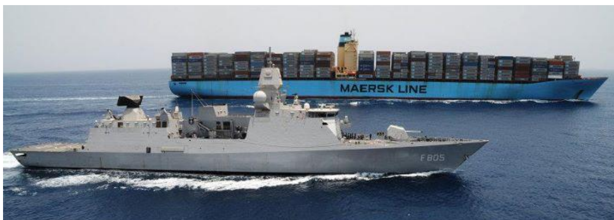
Embarcação escoltando navio da MAERSK

Junto com as forças de outros países incluindo os Estados Unidos, Japão e Austrália, Atalanta agora oferece proteção para 25.000 navios trabalhando através da região a cada ano.