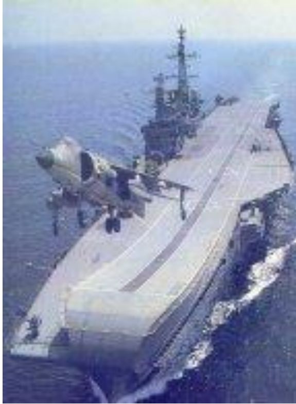
FIGURA 2 – Porta-aviões Viraat