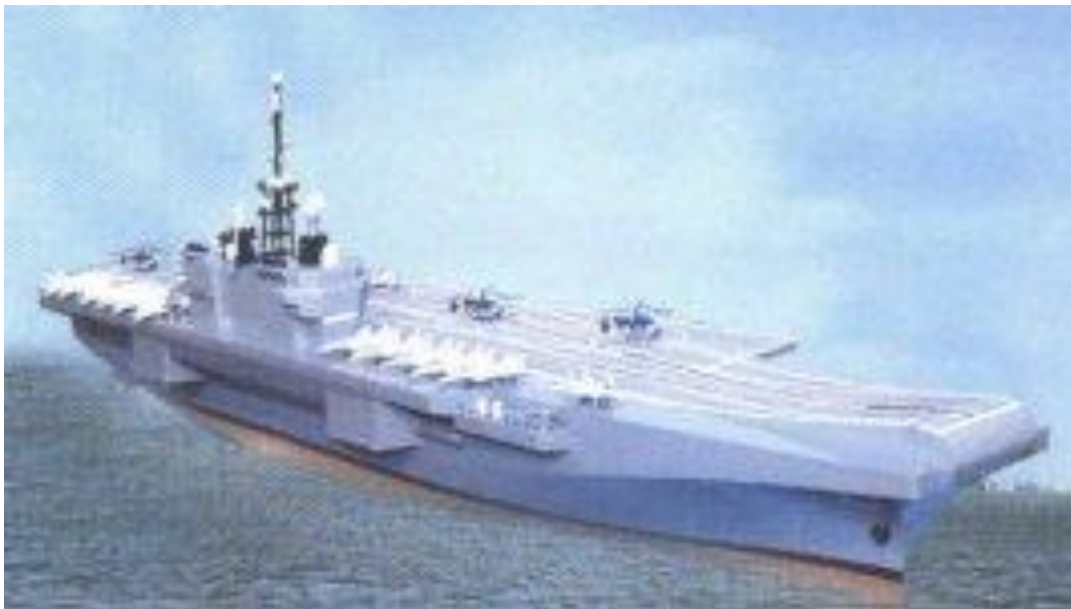
FIGURA 3 – Air Defense Ship (ADS)