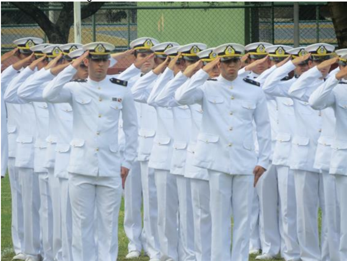
figura 2- Alunos da EFOMM em formatura.

Ao terminar o curso, o aluno será declarado Bacharel em Ciências Náuticas (curso de nível superior), e passará a integrar o quadro de Oficiais da Reserva não remunerada da Marinha do Brasil, no posto de 2º Tenente.