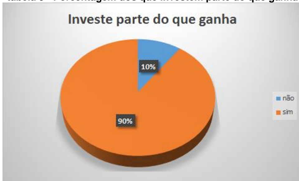
tabela 5 - Porcentagem dos que investem parte do que ganha