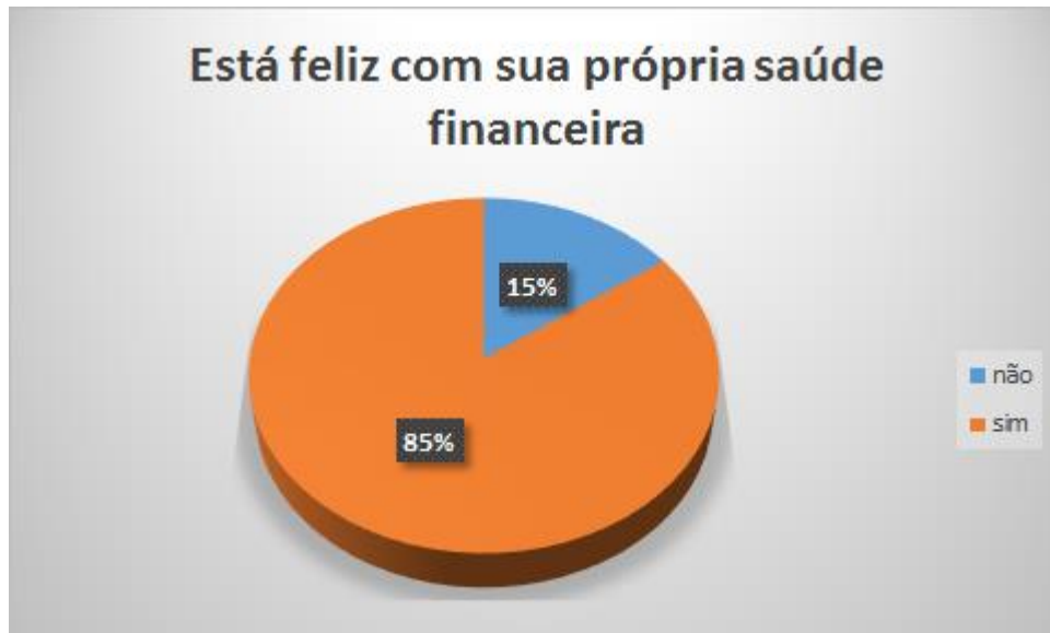
tabela 4 - Porcentagem dos participantes que estão felizes com sua saúde financeira