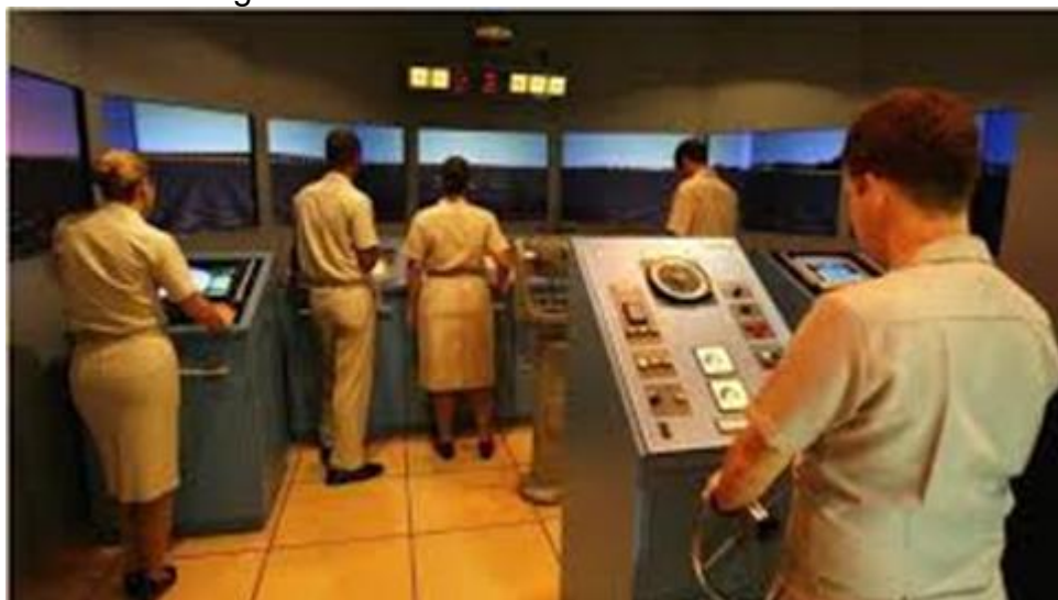
figura 1- Alunos da EFOMM no simulador