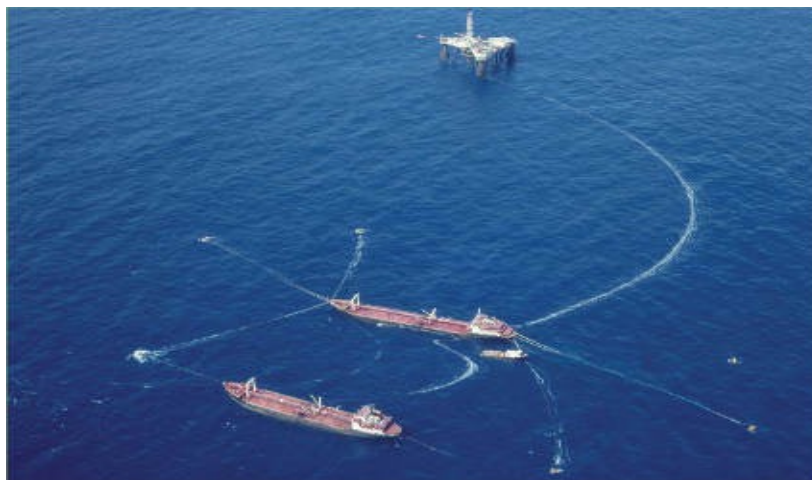
Sistemas de produção antecipada – Bacia de Campos