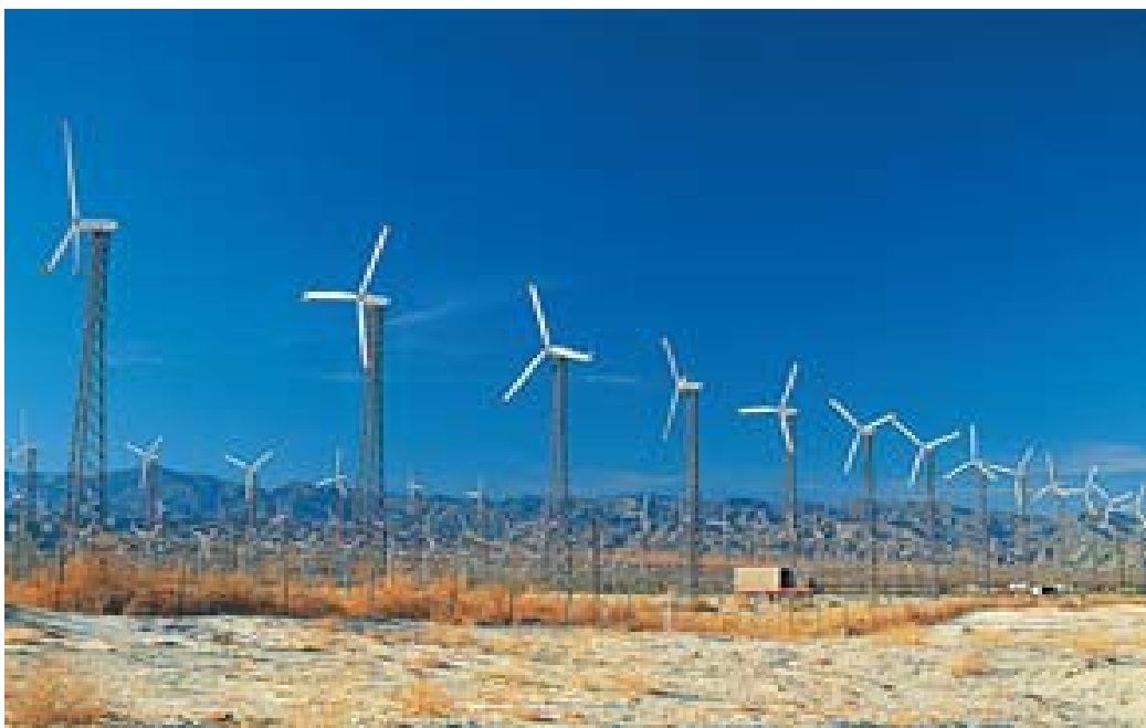
Usina eólica na Califórnia (USA): Geração de energia elétrica sem impacto ao meio ambiente

Na figura abaixo temos uma visão de uma usina eólica no estado da Califórnia, nos Estados Unidos.