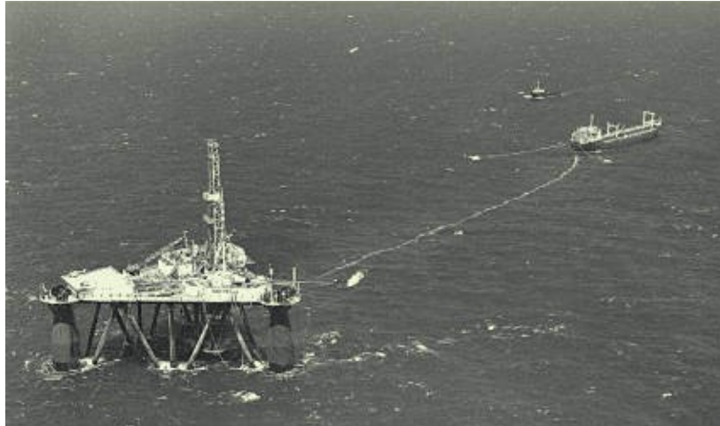
A plataforma Sedco 135-D foi a primeira plataforma a produzir no Campo de Enchova, na Bacia de Campos

Em 1974, é descoberto petróleo na Bacia de Campos (RJ), no Campo de Garoupa. Em 1975, o governo federal autoriza a assinatura de contratos de serviços com cláusula de risco, o que permitiu a participação de empresas privadas na exploração. Por este contrato, as empresas investiam em exploração e, caso tivessem sucesso, receberiam os investimentos realizados e um prêmio em petróleo ou em dinheiro, mas a produção seria operada pela Petrobras. Houve apenas uma pequena descoberta na Bacia de Campos com a aplicação deste tipo de contrato. Em 1977, entra em operação o Campo de Enchova, o primeiro a produzir na Bacia de Campos, com a utilização do Sistema de Produção Antecipada. Pela primeira vez produz-se no Brasil a 120 metros de lâmina d'água. No final do anos 70, essa era considerada uma grande profundidade.