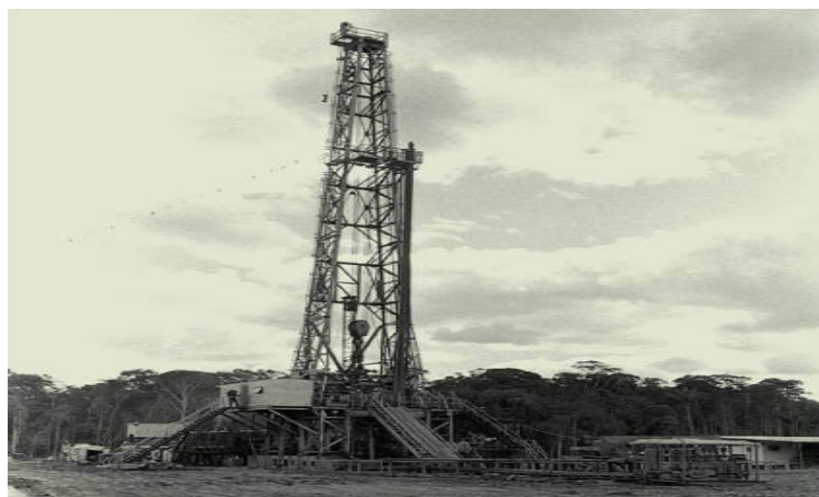
Entra em produção o Campo do rio Urucu, no Alto Amazonas.