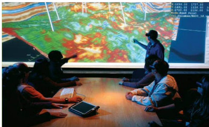
Sala de visualização sísmica 3D da Base de Imbetiba – Unidade da Bacia de Campos

Encontrados os primeiros indícios de petróleo no Pré-Sal na Bacia de Santos (SP). Conclusão das análises no segundo poço do bloco BM-S-11 (Tupi) indica volumes recuperáveis entre 5 e 8 bilhões de barris de petróleo e gás natural.