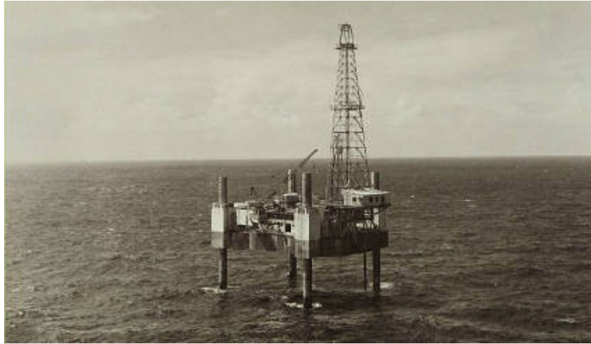
Plataforma elevatória P-1, primeira plataforma móvel de perfuração da Petrobras construída nos anos de 1967 e 1968