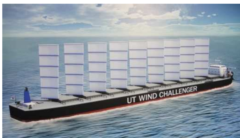
Figura 5 – Fonte: Randolph Johnson

Com o cenário local favorável, os jovens engenheiros que investiram no desenvolvimento das velas do futuro, tinham pela frente os entraves já conhecidos por antecessores que propuseram anteriormente a volta do uso do vento como propulsão auxiliar para navios cargueiros. Priebe (1986) concluiu que o maior problema que se apresenta para a utilização de velas auxiliares para navios cargueiros é aonde e como instalar as mesmas já que precisam ser grandes de modo a propiciar algum ganho, mas, ao mesmo tempo, não podem dificultar o acesso a carga e tampouco causar maior resistência ao avanço do navio em condições de vento desfavoráveis. O conceito desenvolvido pelo japonês Kiyoshi Uzawa de um cargueiro equipado com velas rígidas supostamente proporcionaria uma economia de aproximadamente trinta por cento no consumo de combustível. Ao observar-se a embarcação, no entanto, é evidente que para atingir este patamar de economia o equipamento instalado ocupa uma grande área do convés como pode ser observado na figura 5.