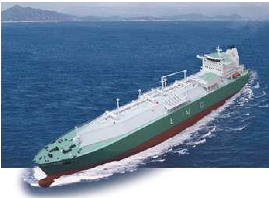
Figura 8

naval. Estes navios são de tamanha complexidade em suas operações que na maioria dos portos são tratados com os mesmos cuidados dedicados a navios nucleares.