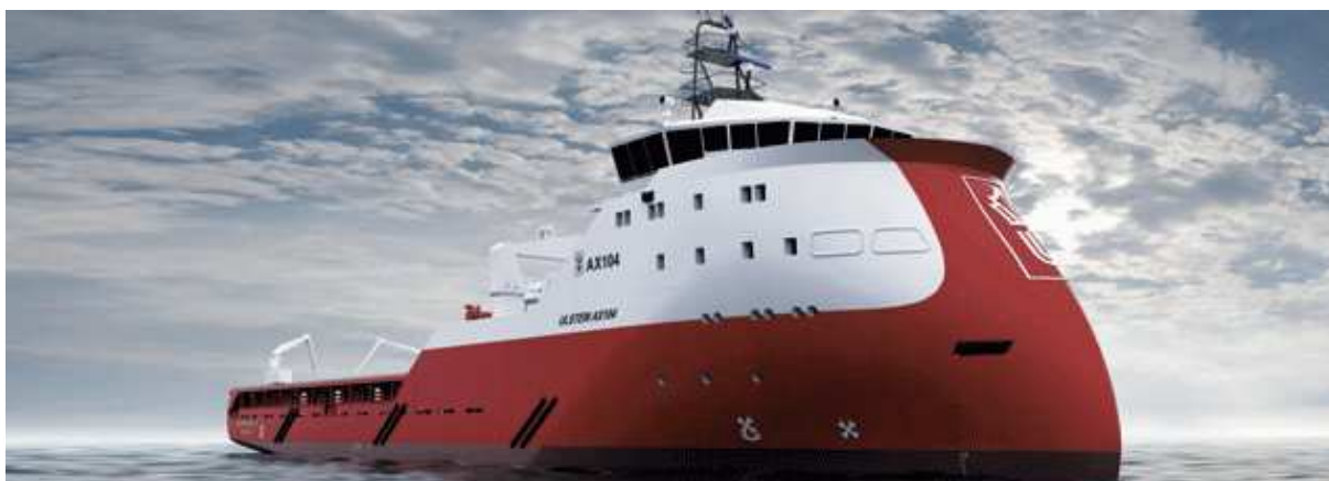
Figura 1 – Fonte: Acervo Ulstein

Desenvolvida com o objetivo de aperfeiçoar as qualidades marinheiras das embarcações e ao mesmo tempo reduzir o consumo de combustível, a tecnologia “X-Bow” é uma marca registrada da empresa norueguesa Ulstein. Criada em 1917 essa empresa se especializou em projetos navais e automação de equipamentos e sistemas para a indústria naval.