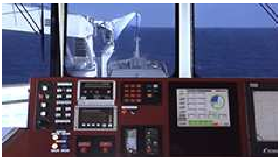
Figura 7

alemãs que exportam equipamentos para geradores eólicos de energia elétrica para realizar o transporte destes equipamentos da Europa para países da América do Sul e Central. Em 2010 o navio aportou no porto de Imbituba, no sul do Brasil, trazendo turbinas eólicas e pás para os projetos em andamento de usinas eólicas de geração de energia elétrica. Segundo Kleiner (2007), o equipamento completo custa de setecentos mil a dois milhões de dólares, mas com a economia de combustível proporcionada o investimento pode ser recuperado no prazo de três a cinco anos.