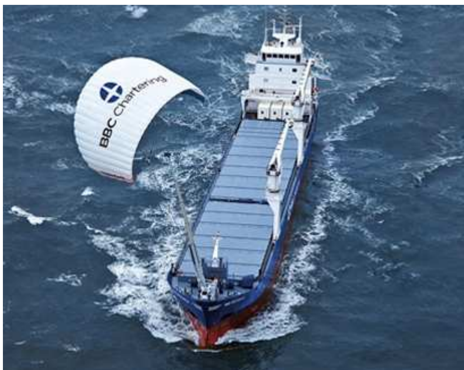
Figura 6

Para solucionar esse problema, a vela utilizada pelo sistema “skysails” está como bem diz o nome, armada no céu sob a forma de uma enorme pipa que pode ter área de 320 metros quadrados e voar tracionando um cabo de 100 a 300 metros de comprimento, o sistema “Skysails” pode ser todo recolhido e estivado a bordo de maneira a ocupar o mínimo espaço causando pouca interferência na operação da embarcação quando não está em uso ou quando o vento não é favorável para o seu uso.