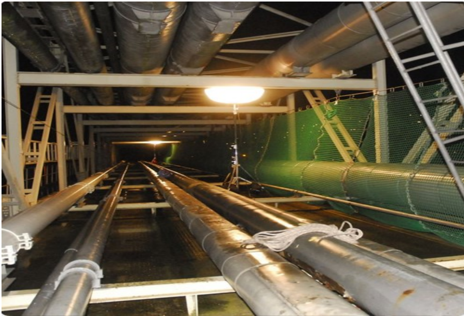
Figura 14 - Iluminação em espaço confinado