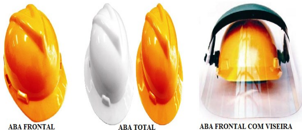
Figura 15 - Exemplos de alguns tipos de capacetes