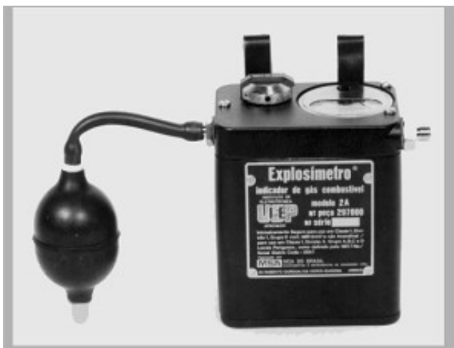
Figura 8 - Explosímetro