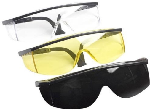
Figura 16 - Tipos de óculos de proteção