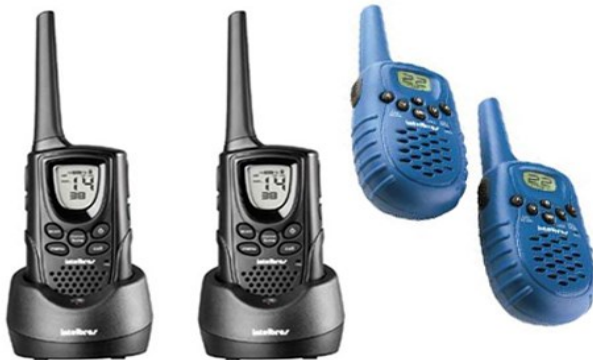
Figura 13 - Exemplo de comunicação sem fio