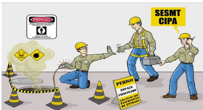
Figura 3 - Entrada em espaço confinado