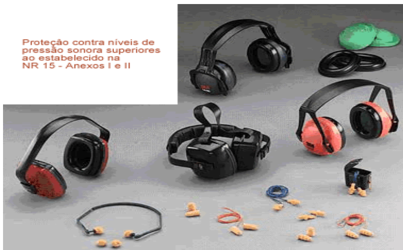
Figura 17 - Diferentes tipos de protetor auricular

Utilizado para proteção dos ouvidos nas atividades e nos locais que apresentem ruídos excessivos.