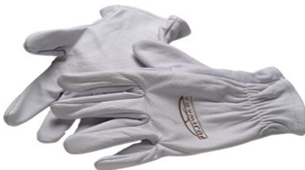
Figura 19 - Tipo de luva para proteção de mãos e punhos

Podem ser utilizadas para proteção das mãos, braços e punhos do empregado contra agentes químicos, biológicos, trabalhos ao potencial, recipientes contendo óleo, graxa, solvente e ascarel, agentes abrasivos e escoriantes e contra choque em trabalhos e atividades com circuitos elétricos energizados.