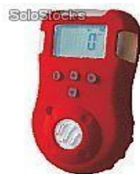
Figura 7- Explosímetro Digital

A fim de evitarmos riscos de explosividade em ambientes de trabalho, devemos sempre conhecer o quanto longe nossa concentração de gás combustível está longe do L.I.E.