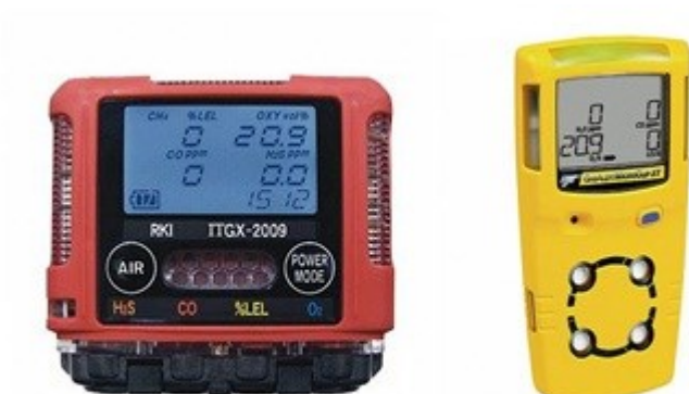
Figura 5 - Detectores multigás

Normalmente os detectores multigás são preparados para a leitura quanto à presença do Oxigênio, do Gás Sulfídrico, do Monóxido de Carbono e de gases combustíveis.