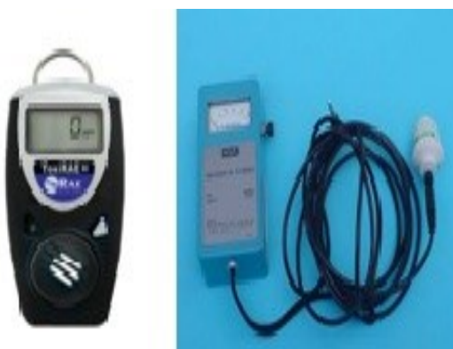
Figura 6 - Oxímetro digital e analógico