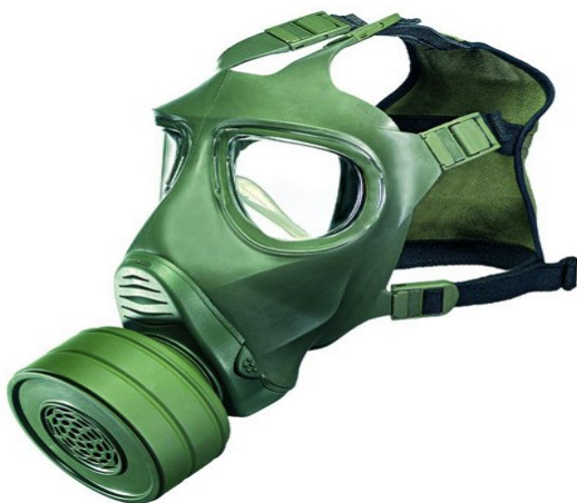
Figura 9 - Máscara de proteção facial (peça inteira)