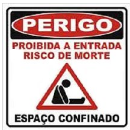
Figura 1 - Etiqueta de segurança

De acordo com a Norma Regulamentadora 33 (norma que tem como objetivo estabelecer os requisitos mínimos para identificação de espaços confinados e o reconhecimento, avaliação, monitoramento e controle dos riscos existentes, de forma a garantir permanentemente a segurança e saúde dos trabalhadores que interagem direta ou indiretamente nestes espaços), Espaço Confinado é qualquer área, ou ambiente não projetado para ocupação humana contínua, que possua meios limitados de entrada e saída, cuja ventilação existente é insuficiente para remover contaminantes ou onde possa existir a deficiência ou enriquecimento de oxigênio.