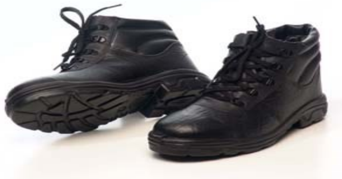
Figura 18 - Bota de segurança

Pode ser utilizadas para proteção dos pés e pernas contra torção, escoriações, queda de objetos pesados (esmagamento), derrapagens, umidade e agentes químicos agressivos.