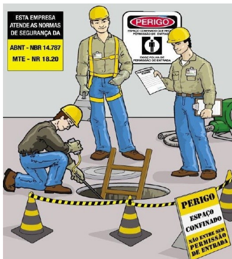
Figura 2 - Procedimentos de entrada em espaço confinado

Dentre elas, podemos citar: Verificar os riscos de acidentes, realizar as medições de nível de oxigênio, gases e vapores tóxicos e inflamáveis, providenciar e manter os equipamentos de segurança e de resgate necessários, além de responsabilizar-se pelas informações contidas na PET(Permissão de Entrada).