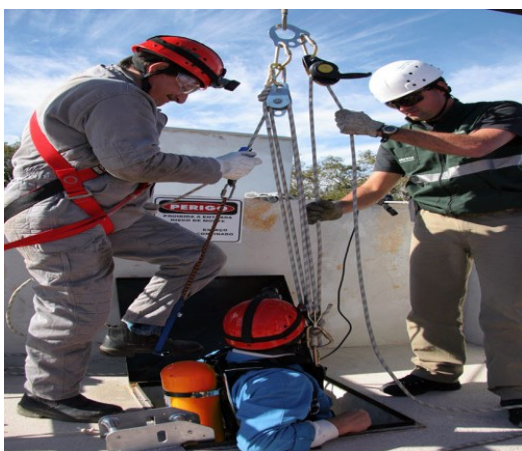
Figura 4 - Segurança e entrada em espaço confinado