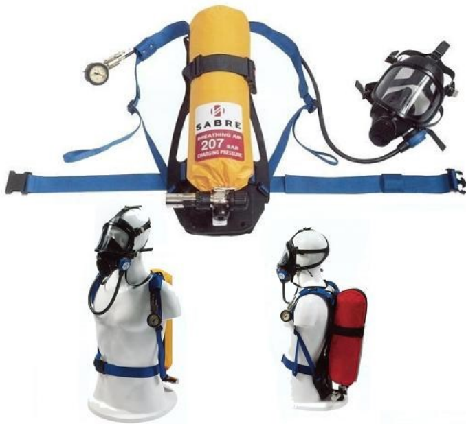
Figura 11- Equipamento autônomo de proteção

b) O tempo de operação é, em si, uma limitação que deve ser adequadamente levada em conta; o usuário deve estar bem ciente da construção, uso, controle e limitações do equipamento, e maneira de atingir rapidamente atmosferas seguras.