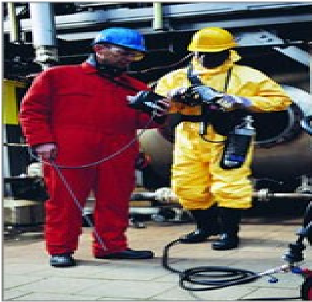
Figura 10 - Trabalhador operando por meio de equipamento por ar de linha