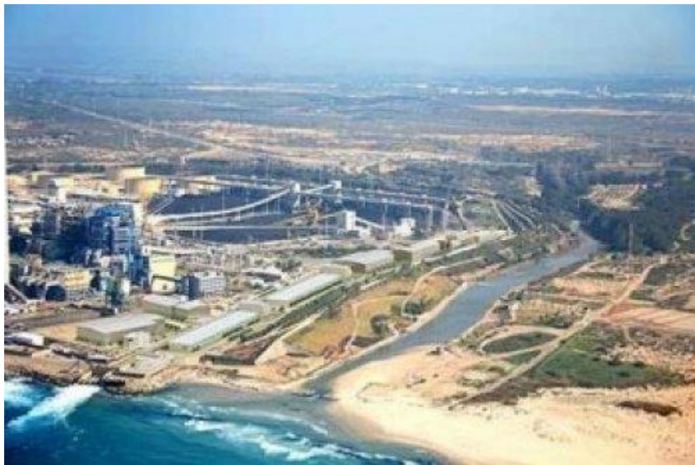
Figura 2: Maior Usina de dessalinização do mundo, em Israel

A maior planta de dessalinização do mundo está localizada em Israel, seguida dos Emirados Árabes Unidos. É utilizado o processo de destilação em múltiplos-estágios para produzir 300 milhões de metros cúbicos de água por ano. Nos Estados Unidos, a maior planta produz cerca de 35 milhões de metros cúbicos por ano.