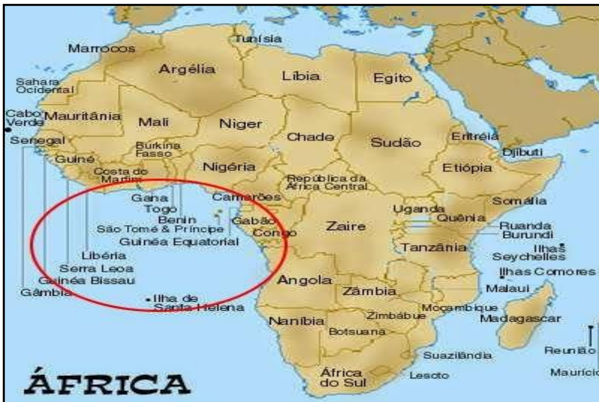
Figura 1: Mapa do Continente Africano com o Golfo da Guiné em destaque.

O Golfo da Guiné, geograficamente, é localizado como a área do Oceano Atlântico entre o Cabo Palmas, no sudoeste da Libéria, e o Cabo Lopez, no Gabão. Entretanto, atualmente, o Golfo da Guiné assumiu um sentido mais amplo, sendo a região marítima que se estende da Guiné até Angola, conforme a ilustração abaixo.