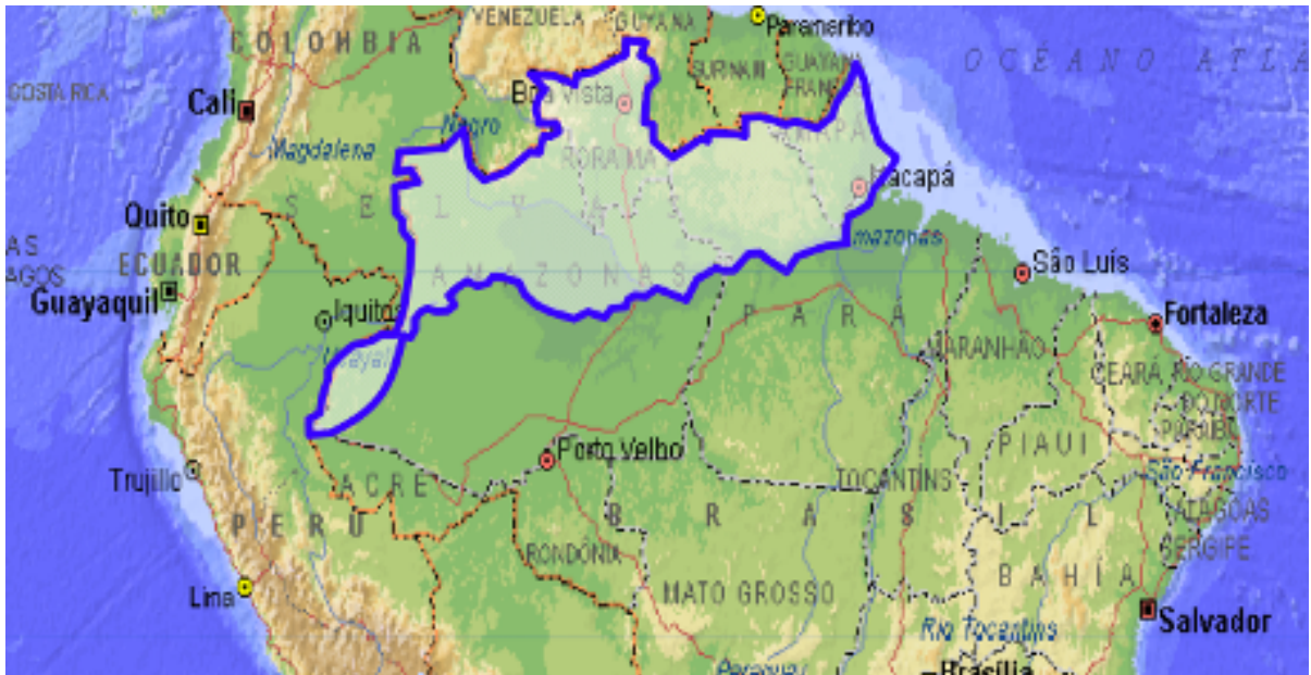
Figura 2 – Área de abrangência do PCN, no período de 1985 a 2003