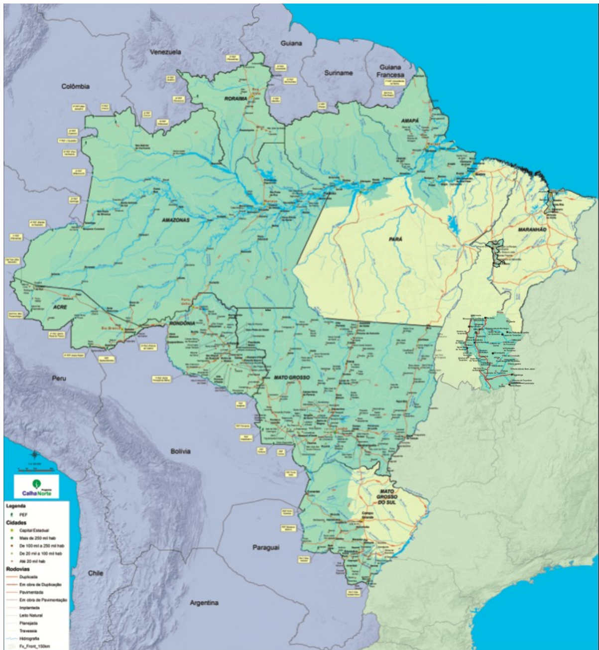
Figura 4 – Atual área de abrangência do PCN