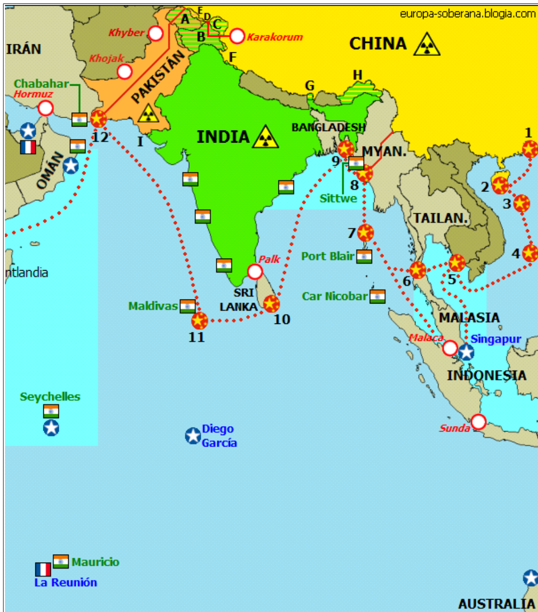
FIGURA 7 – Estratégia do Colar de Pérolas da China.