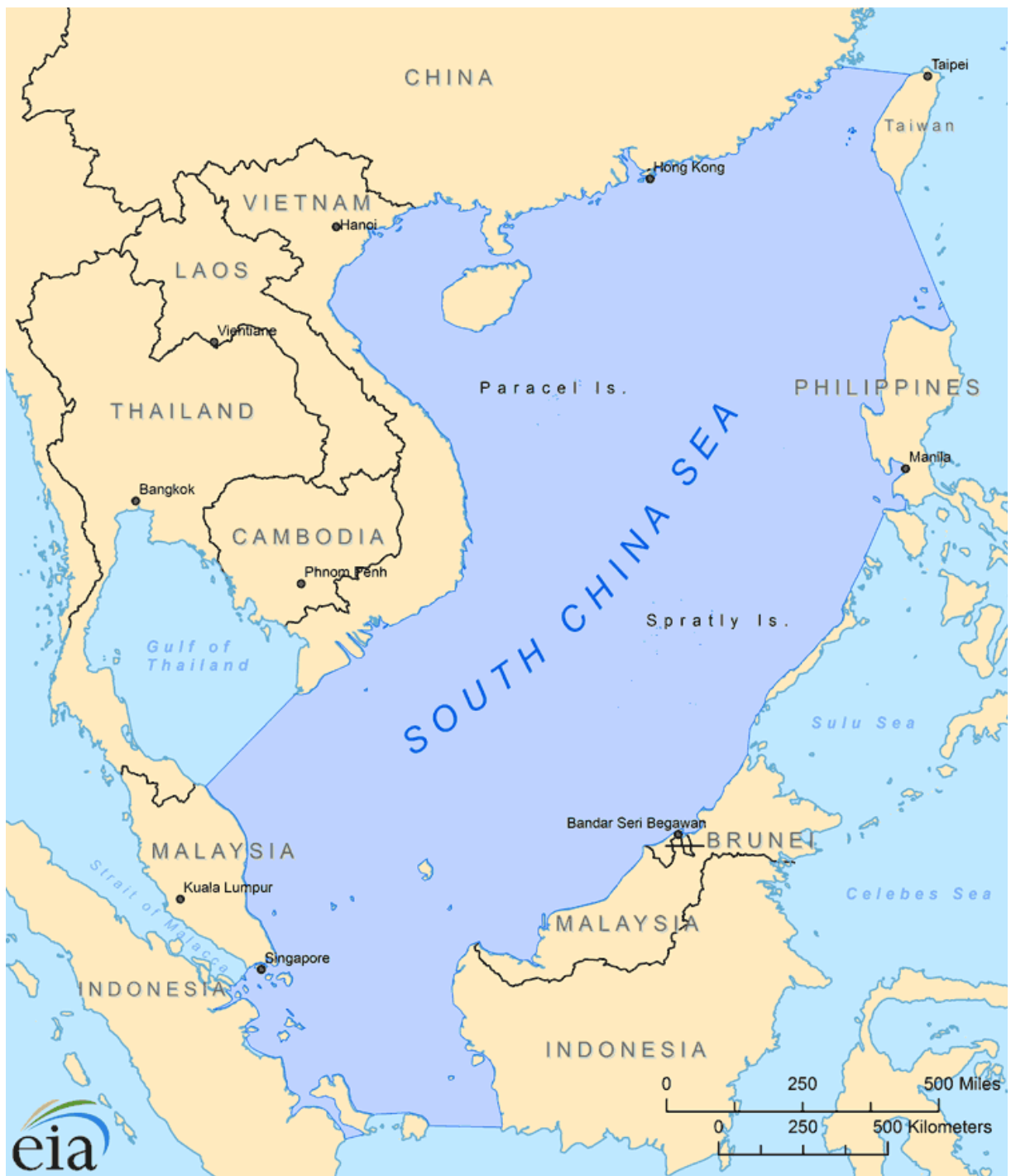
FIGURA 2 – Mar do Sul da China