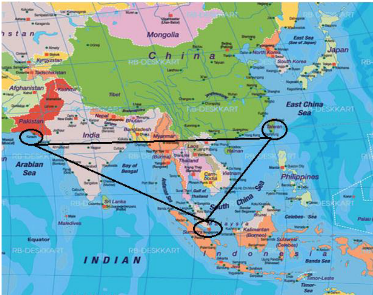
FIGURA 5 – Triângulo Estratégico de Mahan transportado para a o domínio Chinês com vértices em Taiwan, Estreito de Málaca e Paquistão.