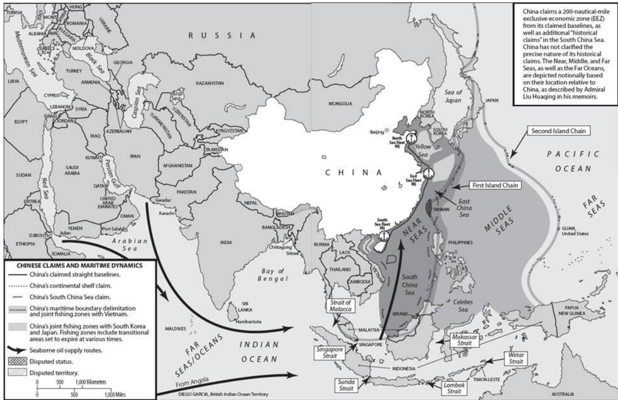
FIGURA 6 – Área de abrangência das Estratégias “Offshore waters defense” e “Open seas protection”.