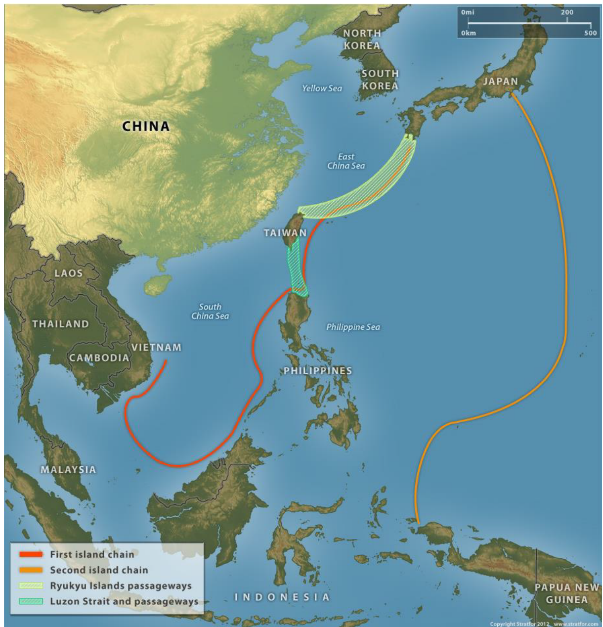
FIGURA 3 – First Island Chain.