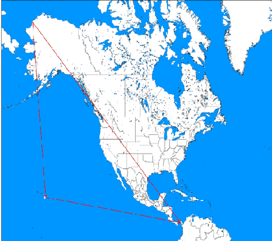
FIGURA 1 - Triângulo estratégico de Mahan aplicado aos Estados Unidos