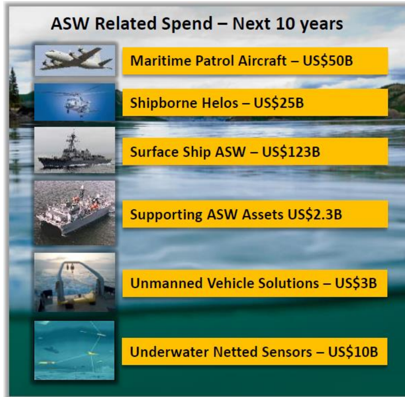
FIGURA 2 – Previsão de gastos mundiais relacionados à Guerra Antissubmarino até 2028.