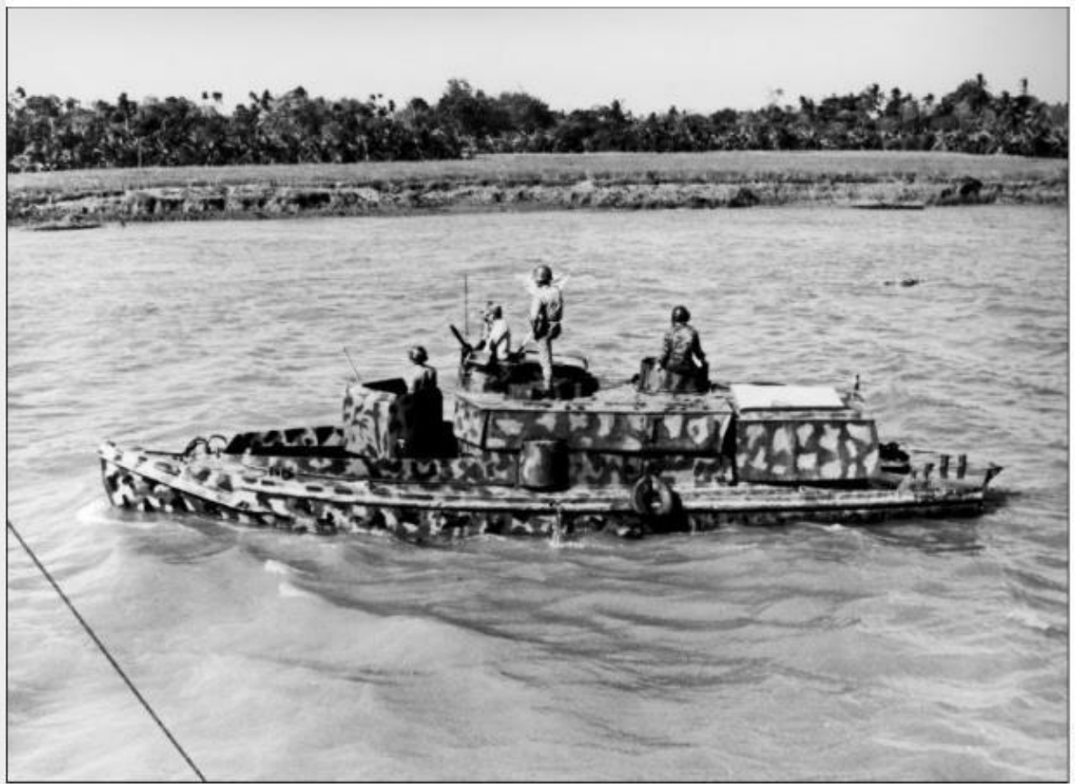
Figura 8 – STCAN/FOM francês.

Fonte: MAROLDA; DUNNAVENT, 2015, posição 209.