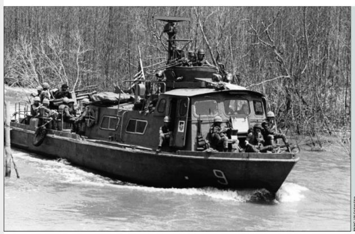
Figura 2 – Fast Patrol Boat (PCF) ou Swift Boat.