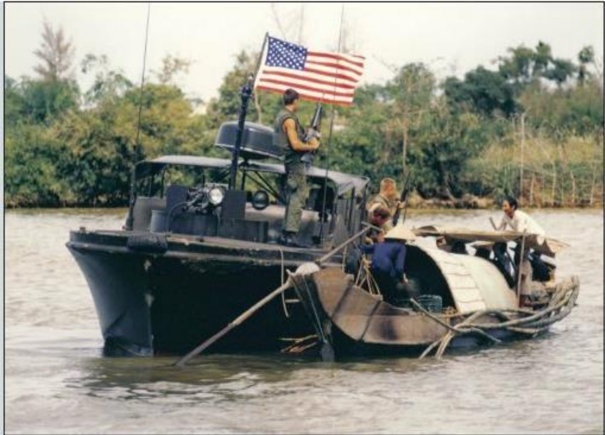
Figura 4 – Patrol Boat, River (PBR).

Fonte: MAROLDA; DUNNAVENT, 2015, posição 398.