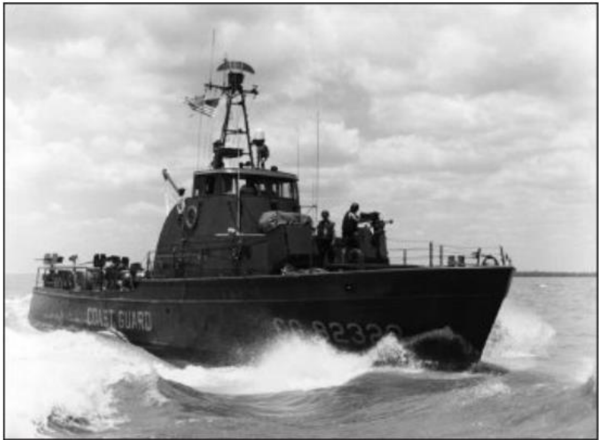
Figura 3 – Patrol Boat (WPB) da USCG.