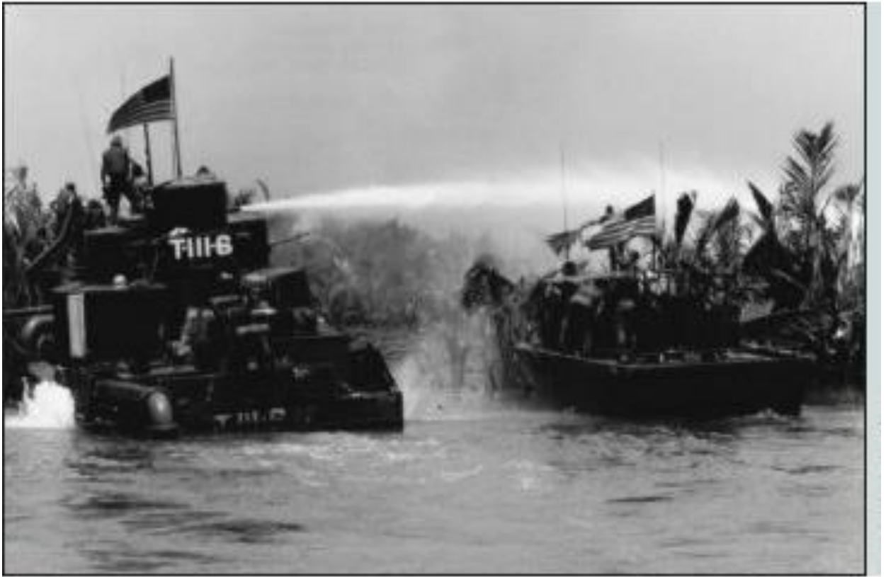
Figura 12 – Douche boats . Armored Troop Carrier (ATC) equipado com canhão d'água.