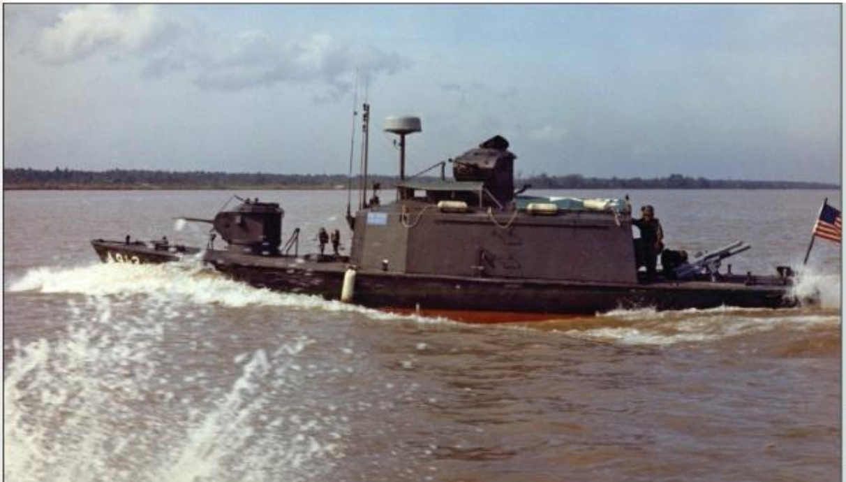
Figura 7 - Armored Support Patrol Boat (ASPB) .