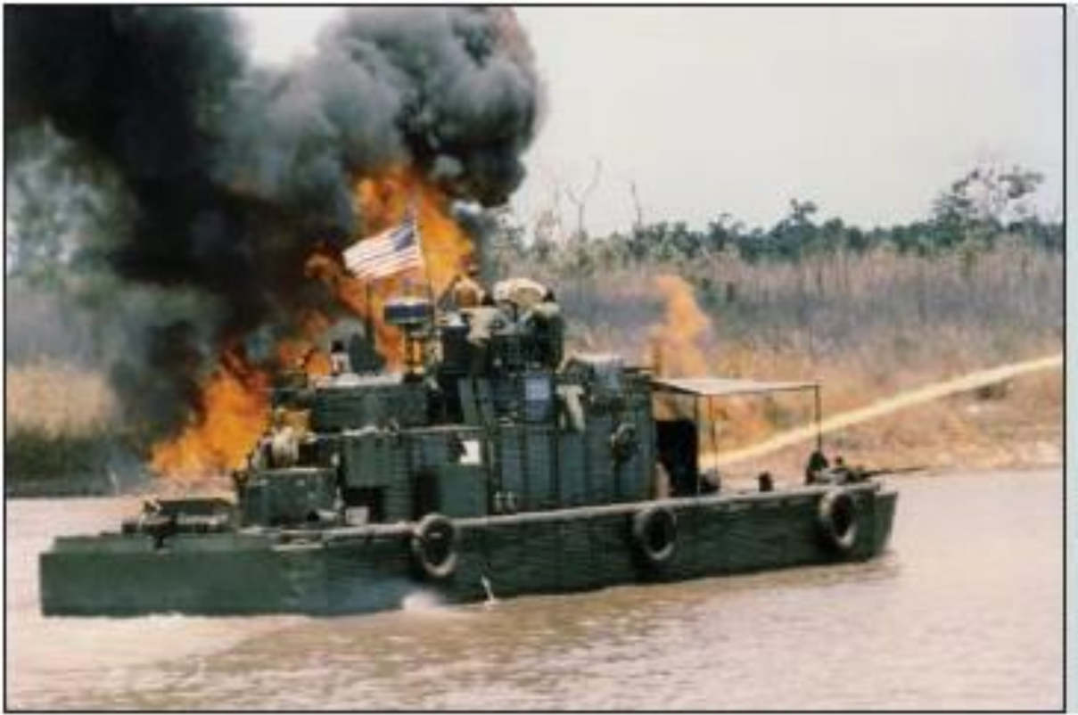
Figura 11 – Zippo monitor equipado com lança-chamas.