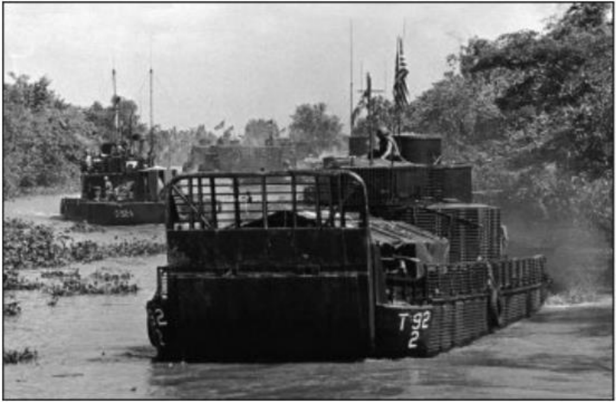
Figura 9 – Armored Troop Carrier (ATC) .

Fonte: MAROLDA; DUNNAVENT, 2015, posição 697.