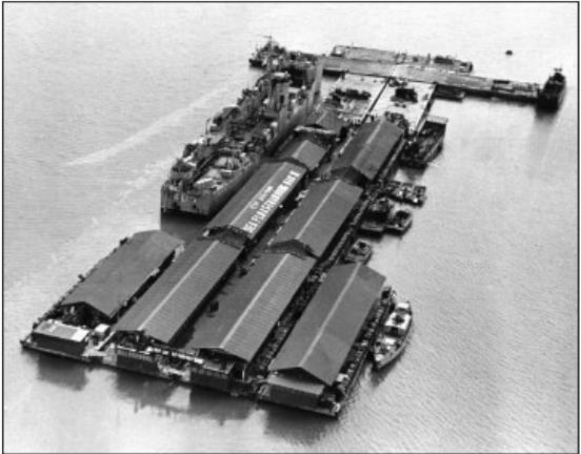
Figura 6 – Base de Combate Flutuante Sea Float .