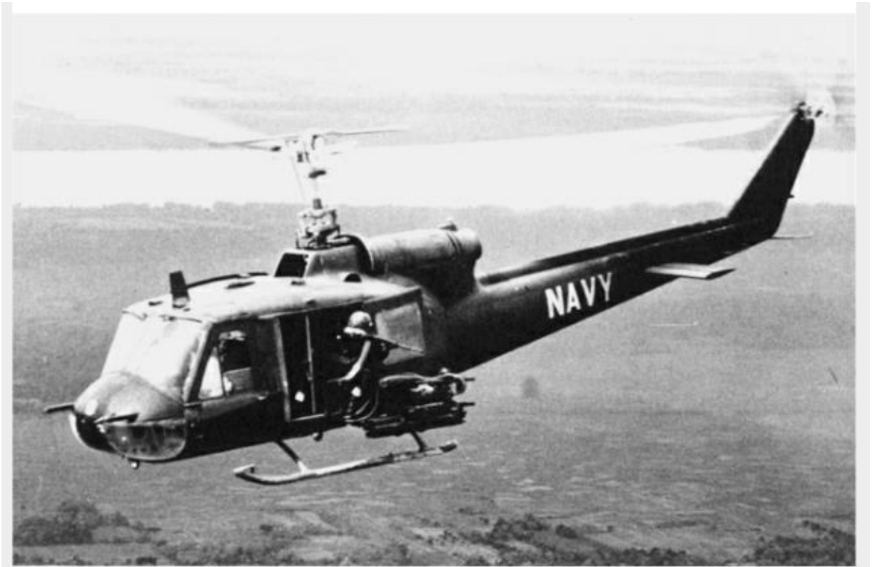
Figura 5 – Helicóptero Seawolf .