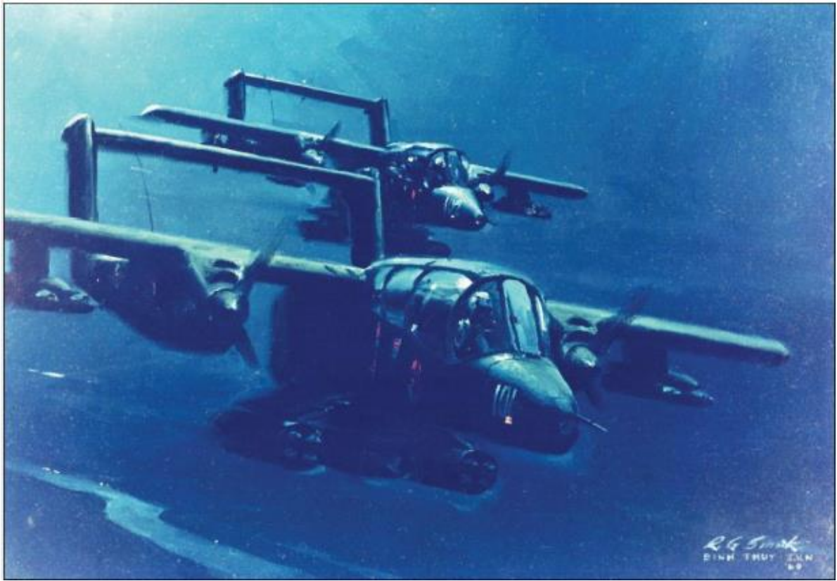
Figura 13 – Aeronaves OV-10ª Bronco.