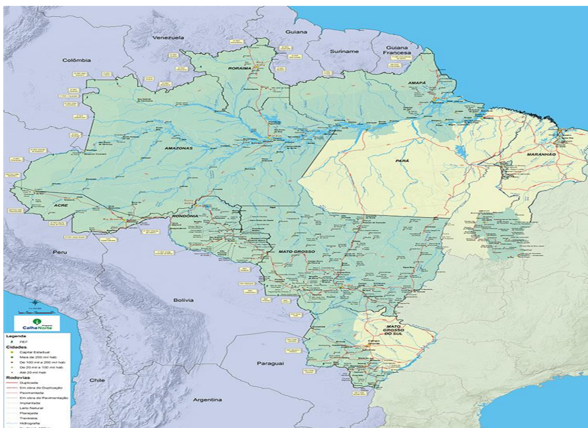
FIGURA 4 - Área de atuação do PCN em 2020

O PCN abrange, atualmente, 442 municípios, distribuídos em dez estados como demonstrado em verde na FIG. 4, sendo eles o Acre, Amapá, Amazonas, Maranhão, Mato Grosso, Mato Grosso do Sul, Pará, Rondônia, Roraima e Tocantins. Ao todo, são 5.986.784 km 2 , o que corresponde a 30% da área do Brasil, atendendo uma população de cerca de 15 milhões de habitantes. Outro dado considerado relevante é que o PCN engloba 85% da população indígena brasileira em uma área que corresponde a 99% da extensão das terras indígenas (BRASIL, 2020g).