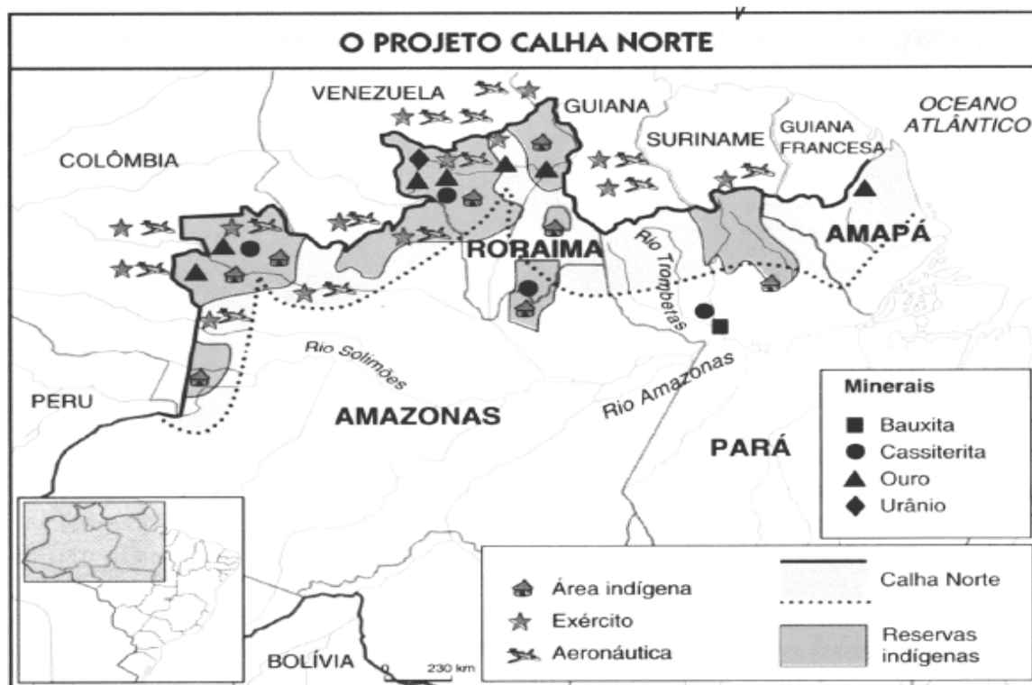
FIGURA 3 – Área de atuação do PCN em 1985

além de promover o desenvolvimento ordenado e sustentável na sua área de atuação, que inicialmente era limitada a área de fronteira, englobando 74 municípios e quatro estados, como mostra a FIG.3 (BRASIL, 2020g).