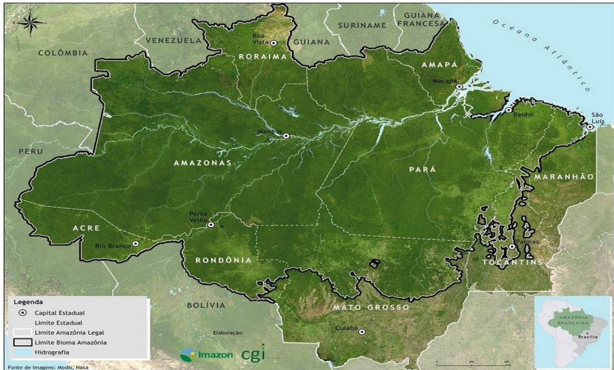
FIGURA 1– A Amazônia Legal atualmente

Amazonas, Mato Grosso, Pará, Rondônia, Roraima e Tocantins e parte do estado do Maranhão como mostra a FIG. 1.