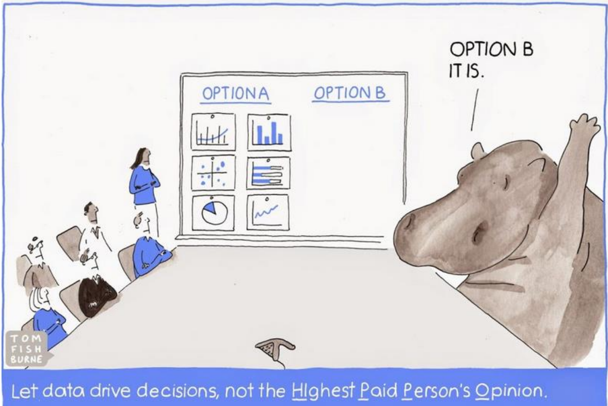
FIGURA 2 – Decisões Orientadas a Dados