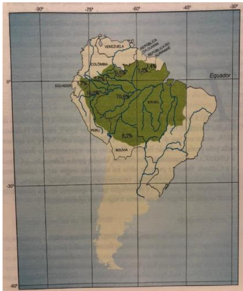
FIGURA 1 - A Pan-Amazônia, segundo a concepção geopolítica do Tratado de Cooperação Amazônica