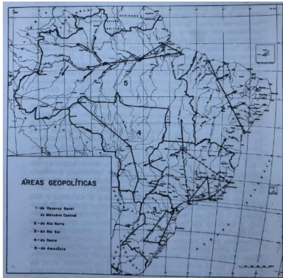
FIGURA 4 - Áreas geopolíticas, segundo Golbery do Couto e Silva