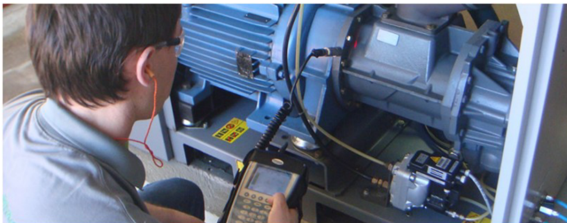
Figura 3: Manutenção Preventiva.

modificação da distribuição de energia vibratória pelo conjunto dos elementos que constituem a máquina. Observando a evolução do nível de vibrações, é possível obter informações sobre o estado da máquina.