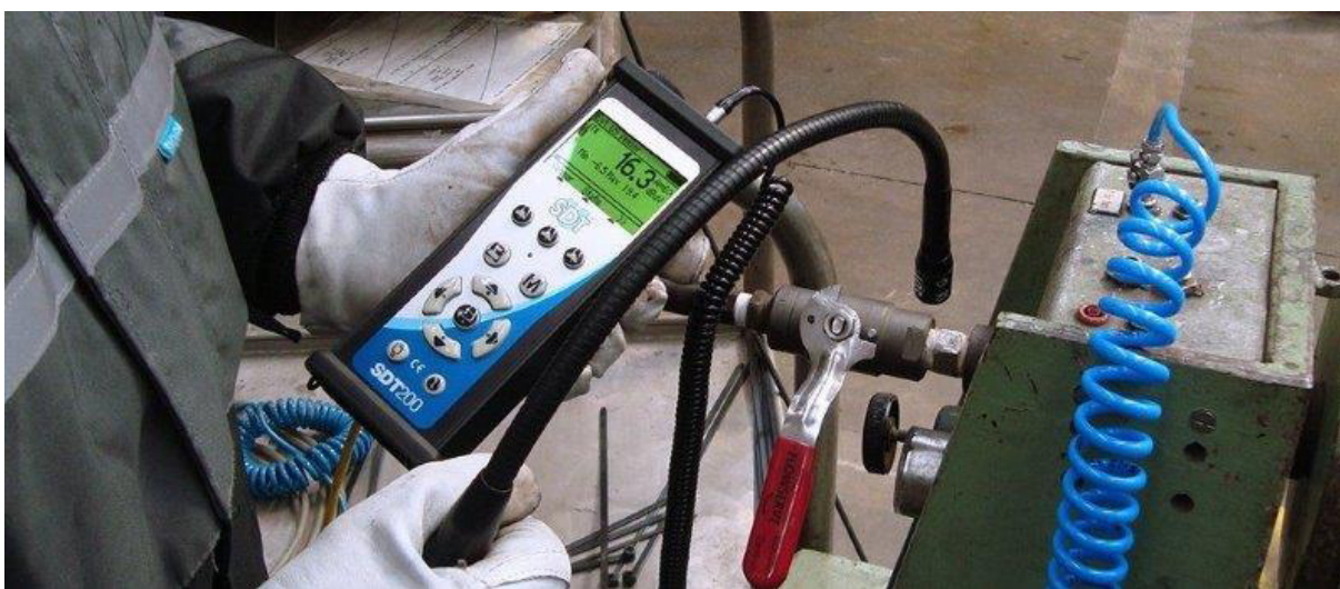
Figura 6: Ensaio ultrassonografia.

As informações recolhidas são registradas numa ficha, possibilitando ao responsável pela manutenção preditiva.