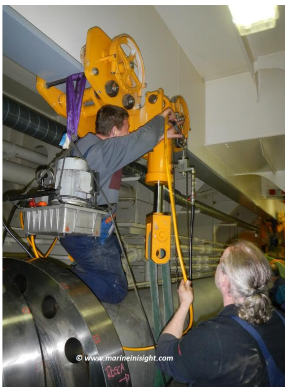
Figura1: Praça de Máquinas.