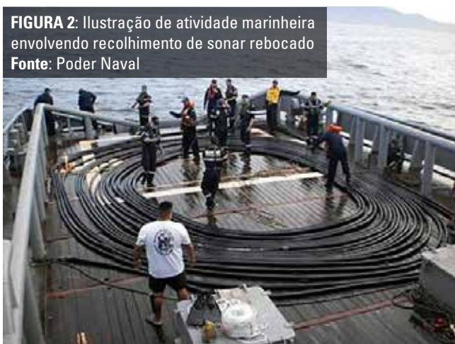
FIGURA 2: Ilustração de atividade marinheira envolvendo recolhimento de sonar rebocado