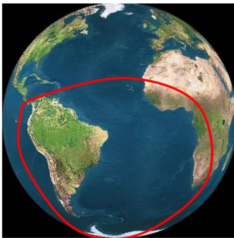
Figura 1 – Entorno Estratégico Brasileiro da PND 2012.

Para a revisão de 2012, em que foi alterada a nomenclatura da PDN, que passou a ser denominada Política Nacional de Defesa (PND), a expressão “entorno estratégico” foi mantida, porém houve nova alteração de sua dimensão espacial, sendo agora visualizado como aquele que “[...] extrapola a região sul-americana e inclui o Atlântico Sul e os países liminhos da África, assim como a Antártica.” (BRASIL, 2012c, subitem 4.1, grifo nosso ) (Figura 1).