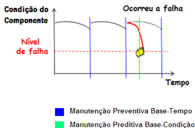
Fig. 3 – Condição (estado) do material pelo tempo usando manutenção programada, baseada no tempo/ciclos; e usando manutenção preditiva, baseada na condição. Adaptado de Cortes ; Albuquerque, 2009.

possibilita a identificação de uma tendência de falha futura de acordo com algum desvio do padrão de comportamento conhecido do sistema. Desta forma uma intervenção de manutenção preditiva pode ser realizada imediatamente evitando a ocorrência da falha, enquanto protege ainda contra riscos latentes associados a defeitos de fabricação. Por isso, do ponto-de-vista da segurança de aviação, a vantagem preponderante é o fato de os componentes serem sempre substituídos antes das falhas. Daí o potencial dos HUMS de melhorar a segurança e confiabilidade, e reduzir os custos operacionais.