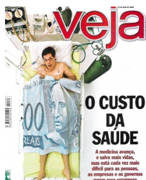
Fig.3: Matéria sobre aumento do custo em Medicina ocasionado pelos avanços tecnológicos