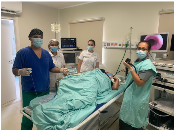
Fig. 4: Imagens da primeira EGD realizada no centro de endoscopia do HNBra, em 13 de setembro de 2021.

tem importante papel na observação de como os recursos materiais, financeiros, humano e logístico estão sendo utilizados e se a finalidade da assistência está sendo alcançada de forma eficiente e eficaz. Na regência de um serviço de saúde, o gestor, dentro da sua governabilidade, deve apresentar visão ampla e senso crítico aguçado para gerenciar os gastos, organizar os processos de trabalho e propor inovações e soluções para motivar sua equipe e também estar aberto a ouvir os seus colaboradores, a fim de que todos os instrumentos dessa “orquestra” funcionem na sua plenitude de maneira harmoniosa para o êxito do serviço.