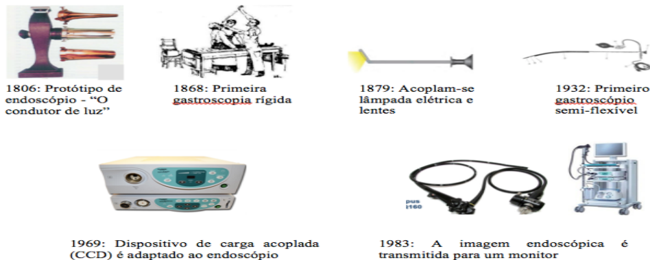
Fig. 1: Resumo dos principais momentos da evolução tecnológica na videoendoscopia.