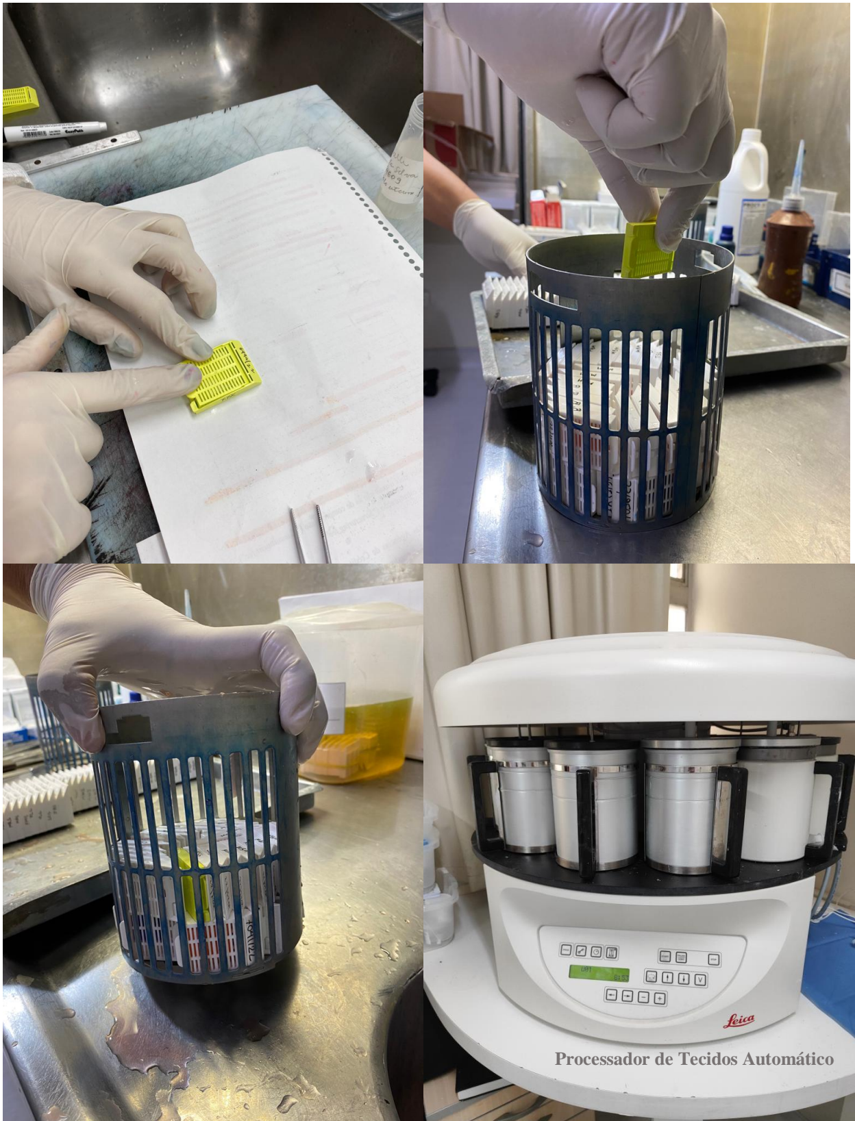
Figura 3: Acondicionamento de amostras prioritárias em cassetes amarelos