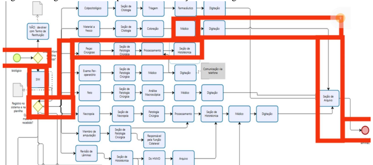
Figura 1: Diagrama de Macroprocesso do Serviço de Patologia