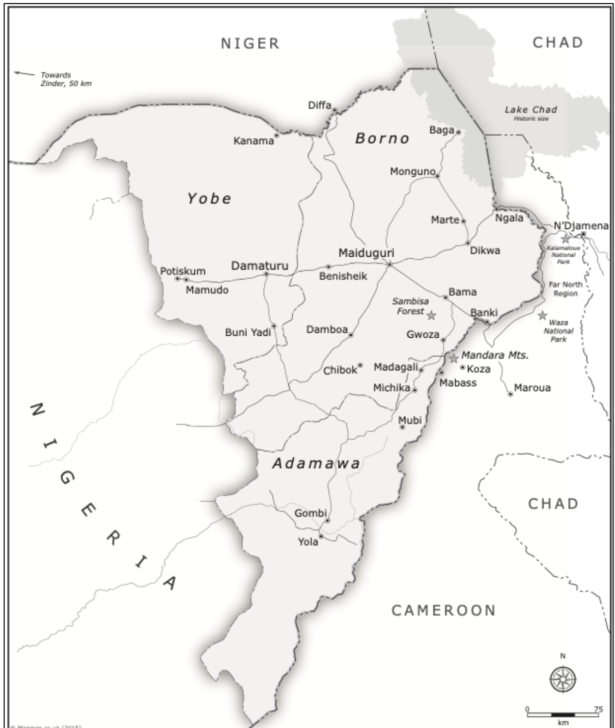
FIGURA 3 – Estados de Yobe, Borno e Adamawa Fonte: COMOLLI, 2015, p. i.x.