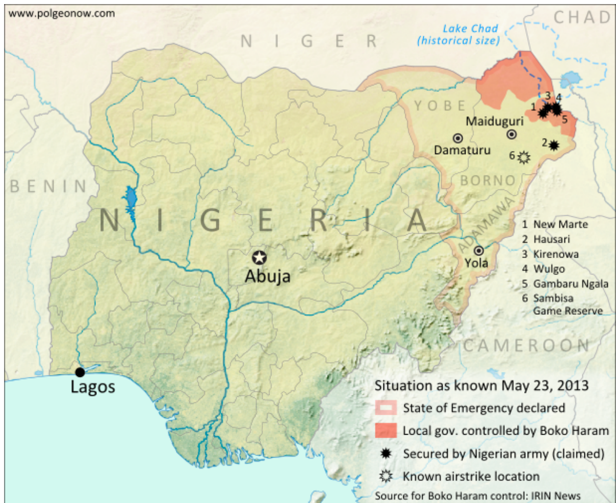
FIGURA 5 – Situação do Boko Haram em 23 de maio de 2013