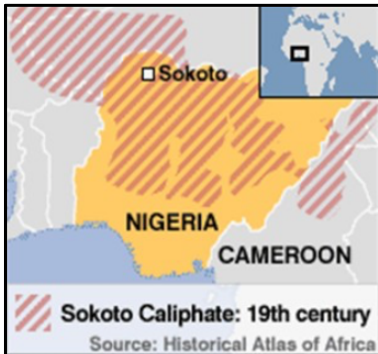
FIGURA 2 – Califado de Sokoto