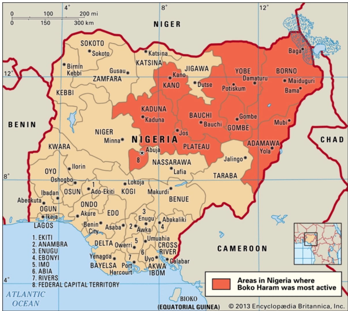
FIGURA 4 – Áreas na Nigéria onde o Boko Haram era mais ativo