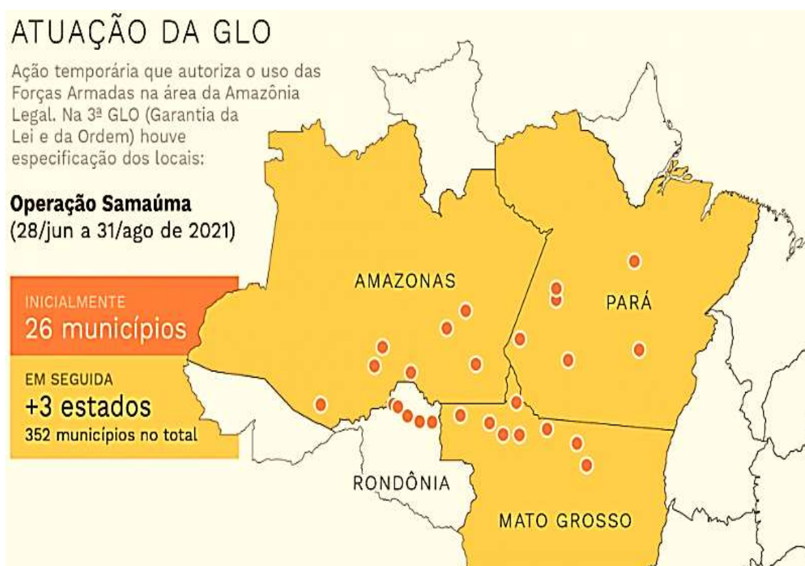
FIGURA 2 – Atuação da Operação Samaúma nos estados.

As Forças Armadas atuaram com o Conselho Nacional da Amazônia Legal e buscaram articulação com os órgãos e as entidades de proteção ambiental e de Segurança Pública, como o Ministério do Meio Ambiente, o Instituto Brasileiro do Meio Ambiente e dos Recursos Naturais Renováveis (IBAMA), o Instituto Chico Mendes de Conservação da Biodiversidade (ICMBio), a Fundação Nacional do Índio (FUNAI), a Polícia Federal (PF) e a Força Nacional (BRASIL, 2021).