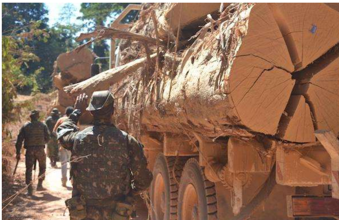
FIGURA 4 - Patrulhamento na Operação Samaúma.

De acordo com o Relatório Anual do Desmatamento no Brasil (RAD), é a primeira vez desde 2019 que o Amazonas ultrapassa o Mato Grosso e o Maranhão, ocupando o segundo lugar. A área desmatada no Amazonas cresceu 50% em 2021 em comparação com 2020 (MAPBIOMAS, 2021).