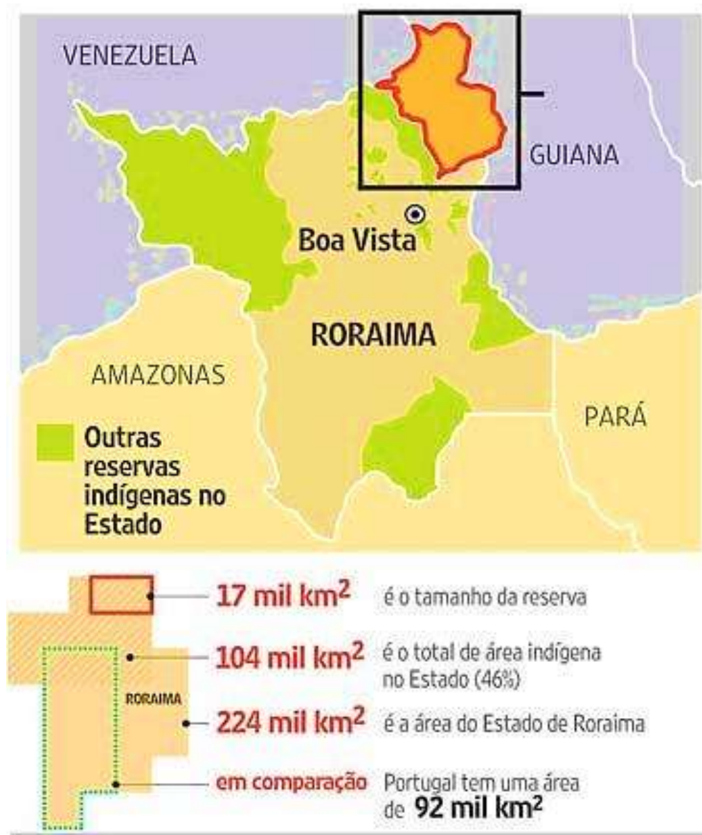
FIGURA 1 – Demarcação da Terra Indígena Raposa Serra do Sol.

Foram estabelecidos critérios de demarcação para terras indígenas (19 condicionantes) e o chamado Conteúdo Positivo do Ato de Demarcação das Terras indígenas, no qual se consagrou a partir de então, a emblemática Tese do Marco Temporal. A discussão da demarcação da Terra Raposa Serra do Sol se arrastou por mais de trinta anos (STARCK; BRAGATO, 2019).