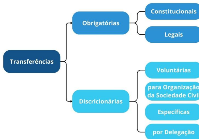
Figura 2 – Tipo de Transferências do Governo

As transferências de recursos entre entes da União são caracterizadas em duas grandes categorias: Obrigatórias e Discricionárias, como demonstrado na Figura 2 (ENAP, 2021). Conceitualmente, o primeiro tipo é decorrente de previsão constitucional ou legal e o segundo é oriundo de negociações entre os governos centrais e os governos subnacionais (DEDA; KAUCHAKJE, 2017).