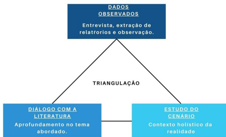
Figura 3 – Modelo de triangulação de dados