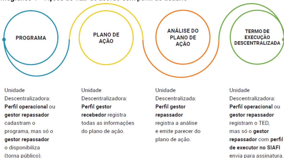
Infográfico 1 – Ações do TED de acordo com perfil do usuário

É possível verificar, no Infográfico 1, o adequado fluxo a ser seguido por um TED na plataforma, combinado a correspondência dos perfis dos gestores que executam as respectivas atividades: