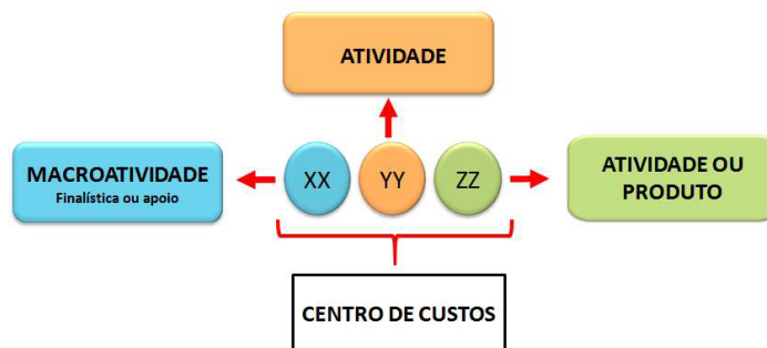
Figura 2 – Codificação dos Centros de Custos do SCM

Para ordenar o conjunto e facilitar a identificação dos Centros de Custos empregados no SCM, adotou-se uma codificação composta por seis números que indicam, além do Centro de Custos, a Atividade e a Macroatividade a que se refere (BRASIL, 2020). A Figura 2 ilustra a composição da codificação de um Centro de Custos: