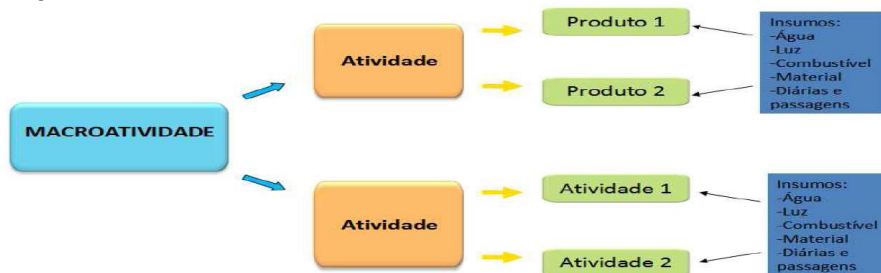
Figura 1 – Estrutura básica do SCM