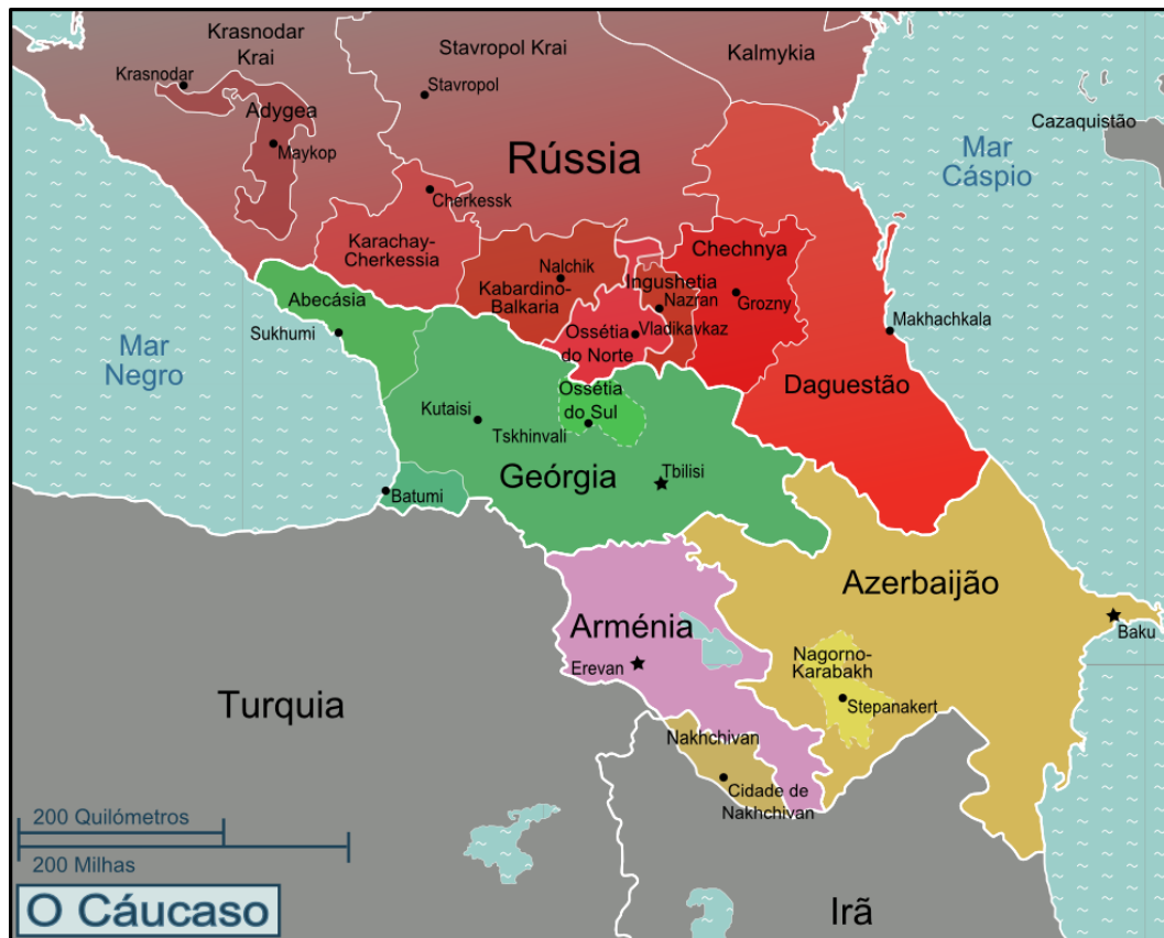
FIGURA 2 – O Cáucaso

Nagorno-Karabakh) e sete repúblicas russas internas (Daguestão, Chechênia, Inguchétia, Ossétia do Norte-Alânia, Kabardino-Balkaria, Karachai-Cherkessia e Adiguéia). Além disso, os insurgentes islâmicos declararam um virtual "Emirado do Norte do Cáucaso" na parte da região controlada pela Rússia. As lutas no Cáucaso têm ramificações globais, como ficou evidente no verão de 2008, quando os militares russos triunfaram sobre o governo da Geórgia, apoiado pelos EUA (FROLOVA, 2006).