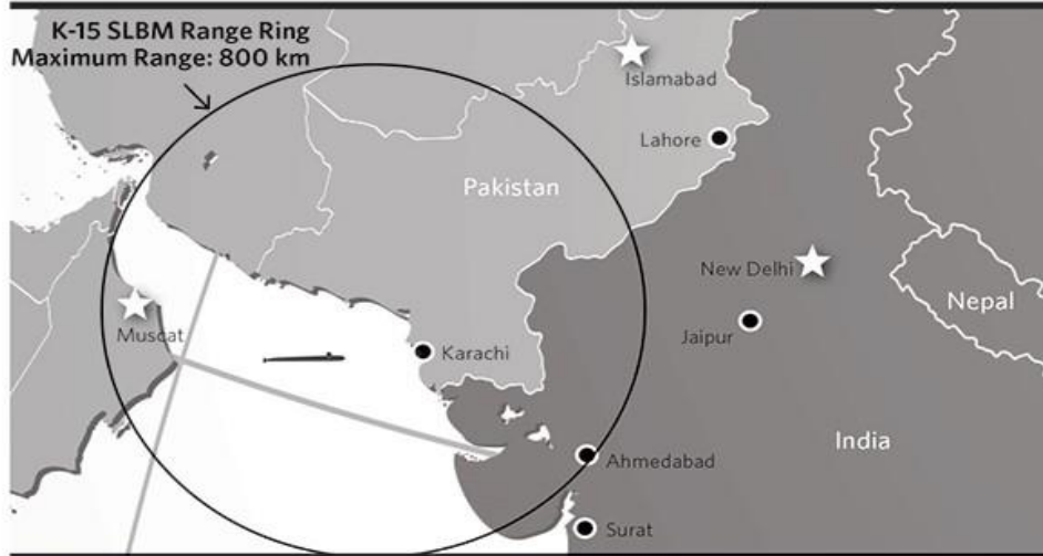
Figura 1 – Alcance do míssil balístico K-15 lançado por submarino no Mar Árabe