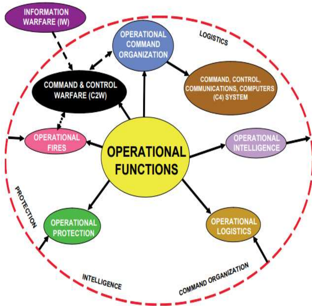
FIGURA 1 – Funções Operacionais (em termos genéricos)