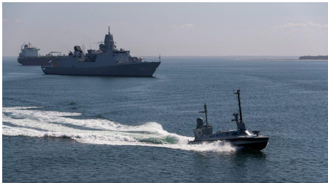
Figura 2: VSNT Marlin

Mas, o que exatamente diferencia os VSNTs? A autonomia é, sem dúvida, uma das suas características mais marcantes. Com algoritmos avançados, esses veículos são capazes de navegar vastas extensões marítimas, executando missões complexas com mínima ou nenhuma intervenção humana. Além disso, eles são projetados para serem extremamente flexíveis, podendo ser equipados com uma variedade de sensores e ferramentas conforme a necessidade da missão.