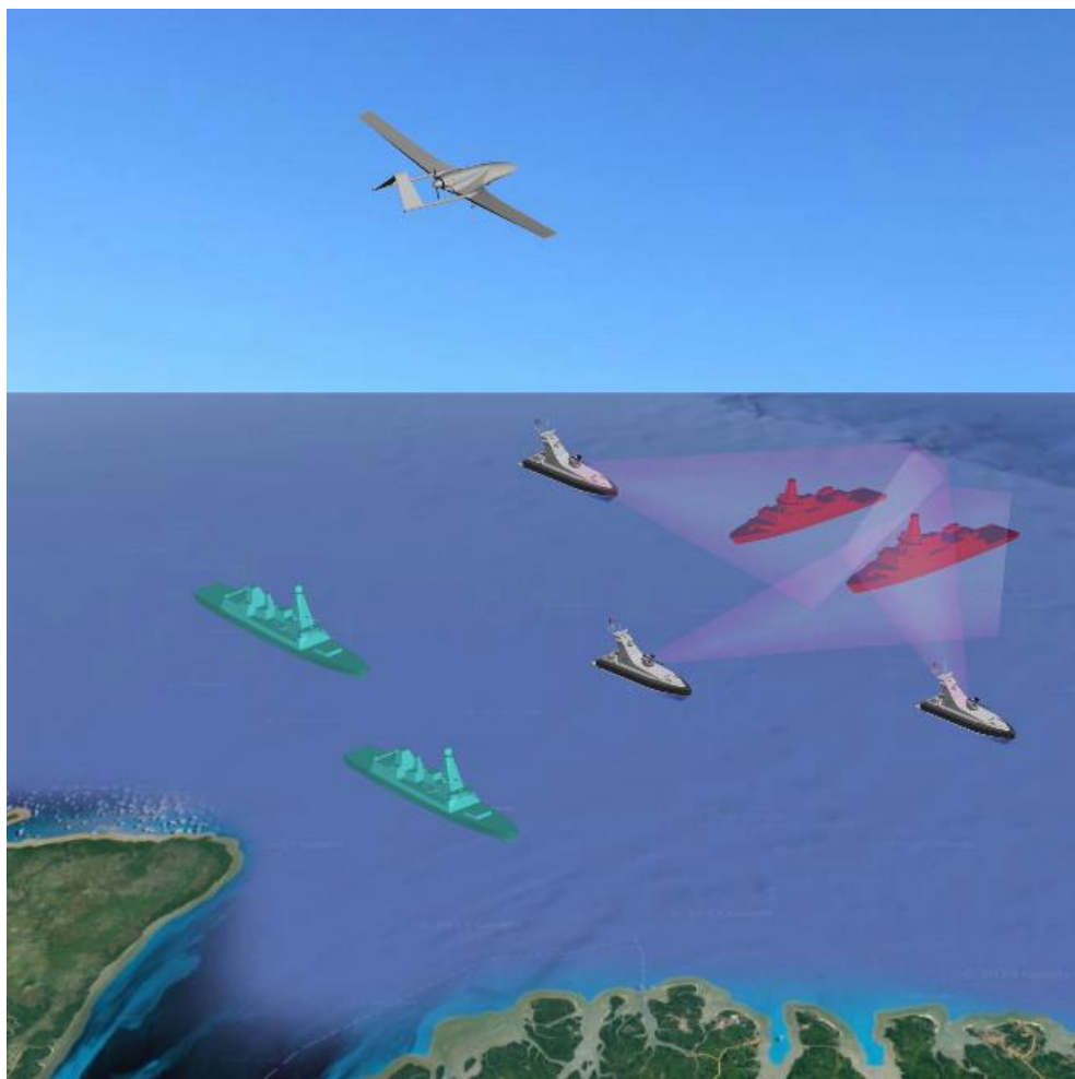
Figura 4: VSNT em ação de bloqueio eletrônico contra navios hostis para mascarar a aproximação de navios amigos.