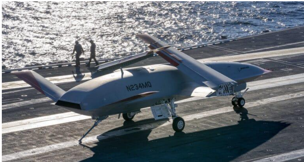
Figura 1: VANT MQ-25

Observa-se que os Veículos Não Tripulados representam um avanço marcante na condução das operações militares modernas, como o VANT MQ-25 ilustrado na Figura 1. Suas capacidades de vigilância em tempo real, precisão em ataques e contribuições para a guerra eletrônica têm transformado a dinâmica dos conflitos armados. Essas plataformas continuam a desempenhar um papel central na estratégia militar contemporânea, influenciando a forma como as operações militares são planejadas e executadas em um ambiente de segurança cada vez mais complexo. Nas próximas subseções serão detalhadas as especificidades desses sistemas.