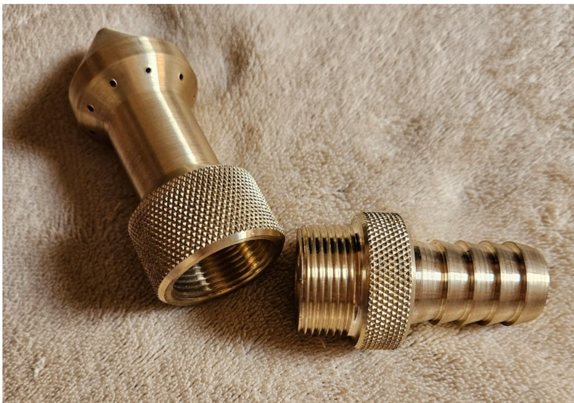
Figura 3 – Bico desobstrutor com funcionamento sob ação retrógrada dos jatos.