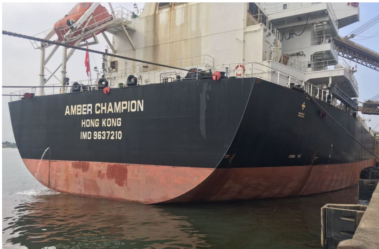
Figura 1 – Acidente no porto de Santos