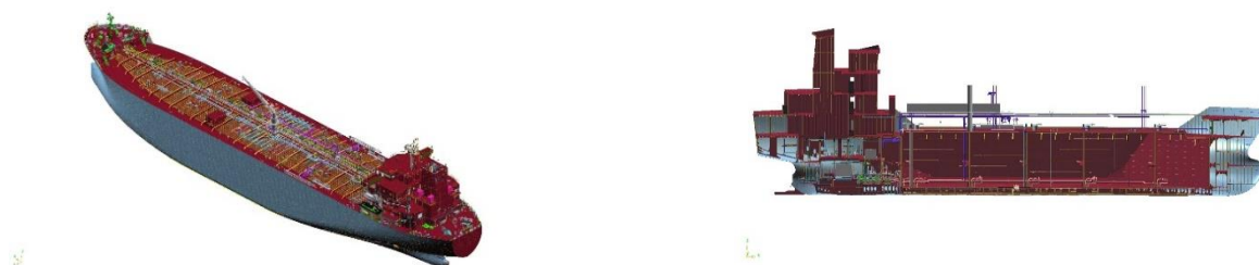
Figura 1: FORAN pela Siemens: A solução marítima CAD/CAM Xcelerator

O CAM tem como objetivo criar um meio mais veloz de produção de acessórios e equipamentos com medidas mais exatas e consistência.