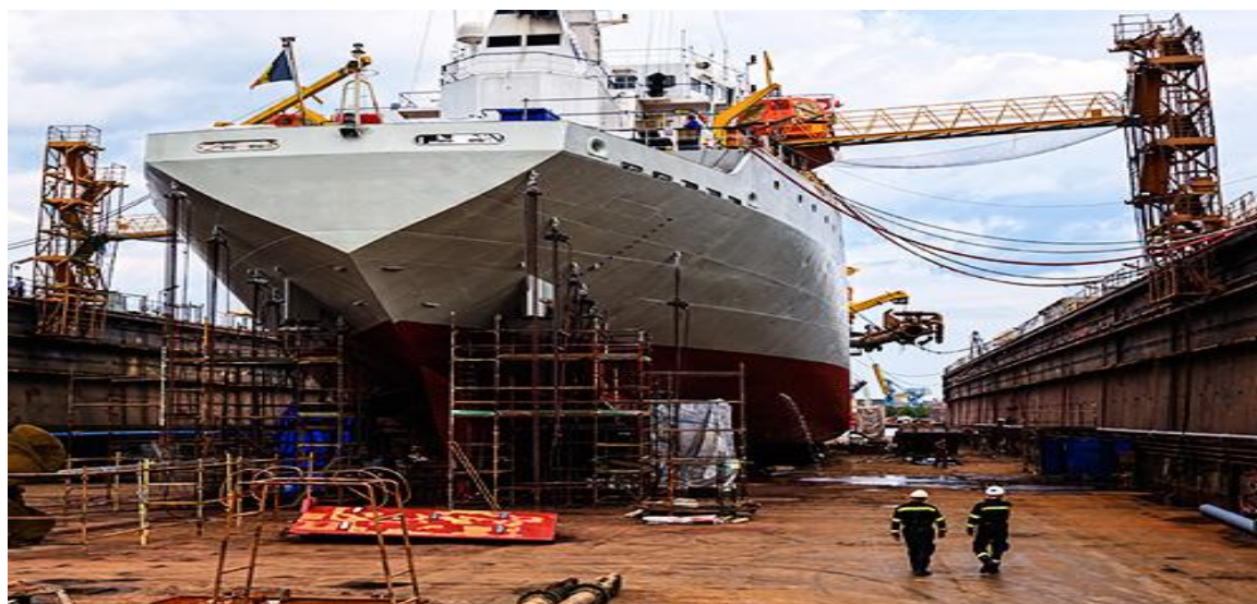
Figura 3: A construção e a reparação naval

Podemos observar, a aplicação prática das ferramentas computacionais na indústria naval, os softwares CAD são usados no design de casco, projeto de compartimentos internos, integração de sistemas, análise estrutural, produção e fabricação, colaboração e revisões e manutenção e reparos; os softwares CAM são empregados no planejamento e controle de produção, fabricação de componentes, soldagem automatizada, montagem de estruturas; e por fim, os softwares CAE são utilizados nas análises estruturais, térmicas, vibração e acústica e impacto e colisão.