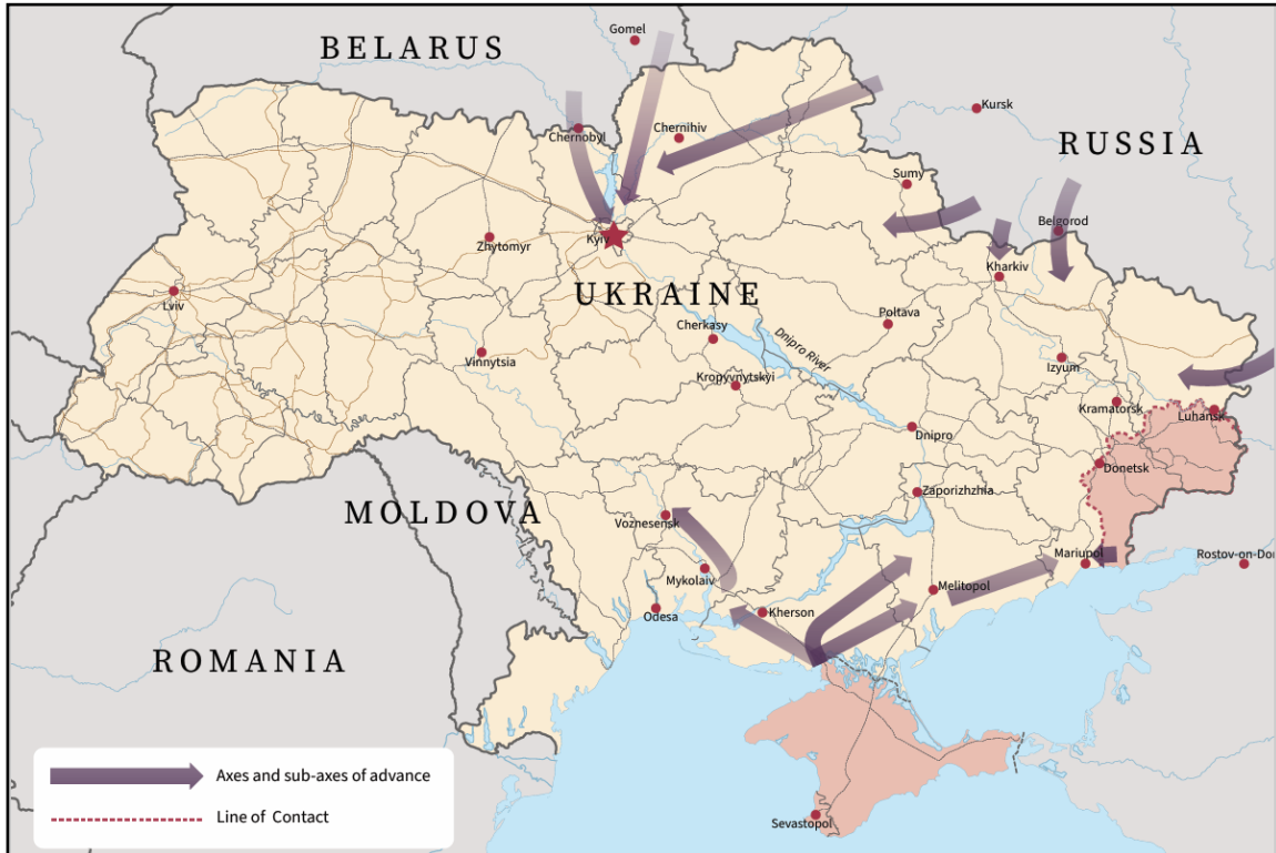
Figura 1 – Representação dos eixos originais de avanço russo em fevereiro de 2022.