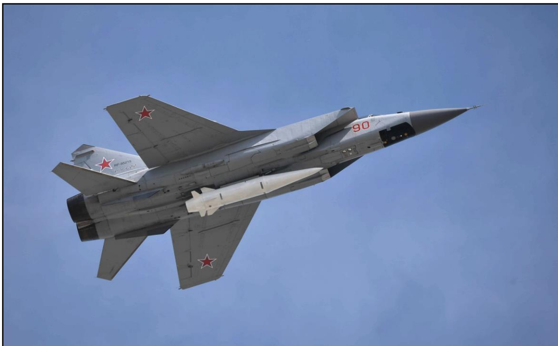
Figura 6 – Missil Kh-47M2 Kinzhal em uma aeronave russa MiG-31K.