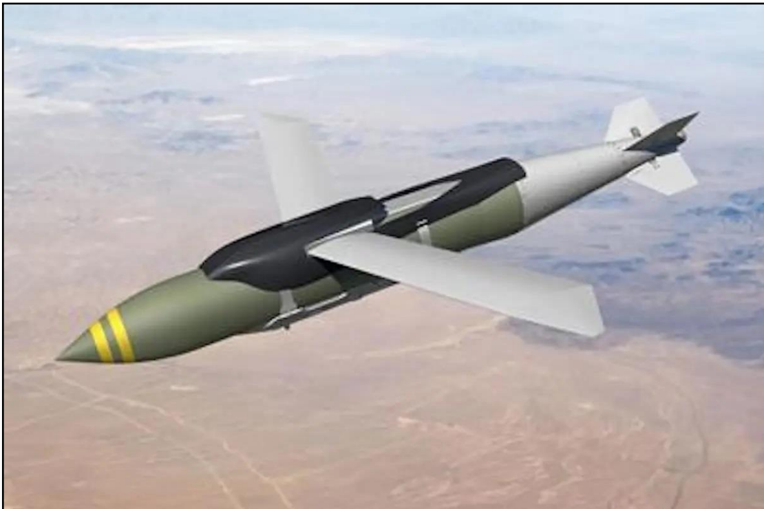
Figura 8 – Glide Bomb russa UPAB1500B.