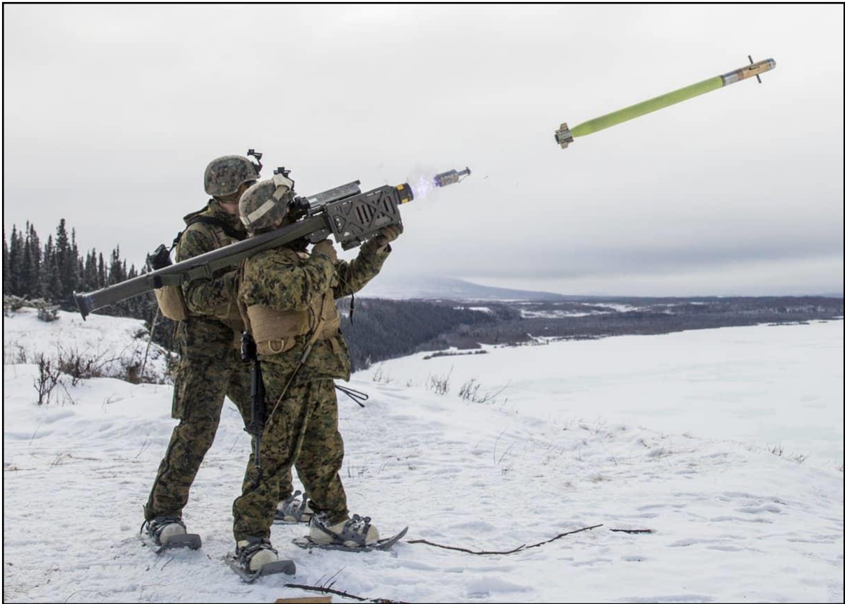
Figura 3 – Disparo de um MANPADS FIM-92 Stinger .