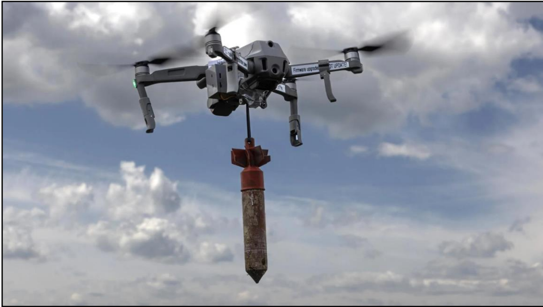
Figura 7 – Drone comercial ucraniano adaptado com munição explosiva.