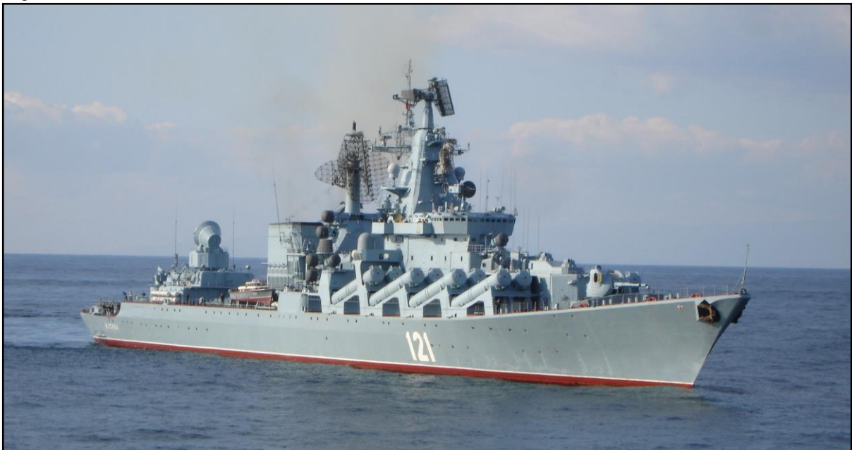
Figura 4 – Cruzador Moskva da Marinha russa, em 14 de fevereiro de 2006.