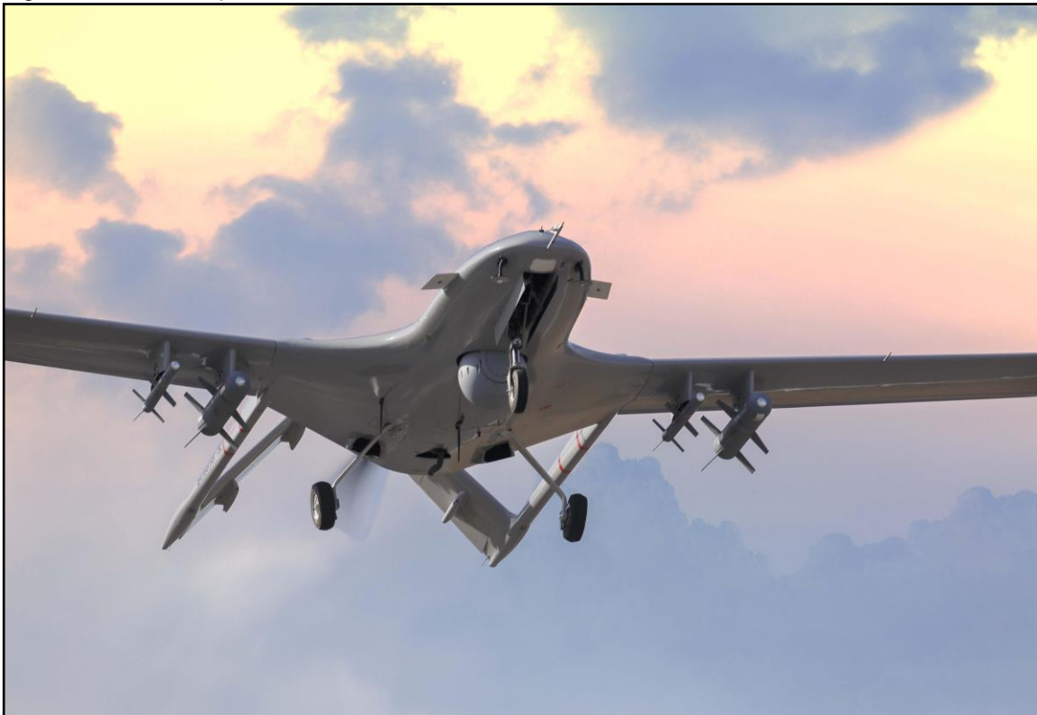
Figura 2 – UCAV Bayraktar TB-2.