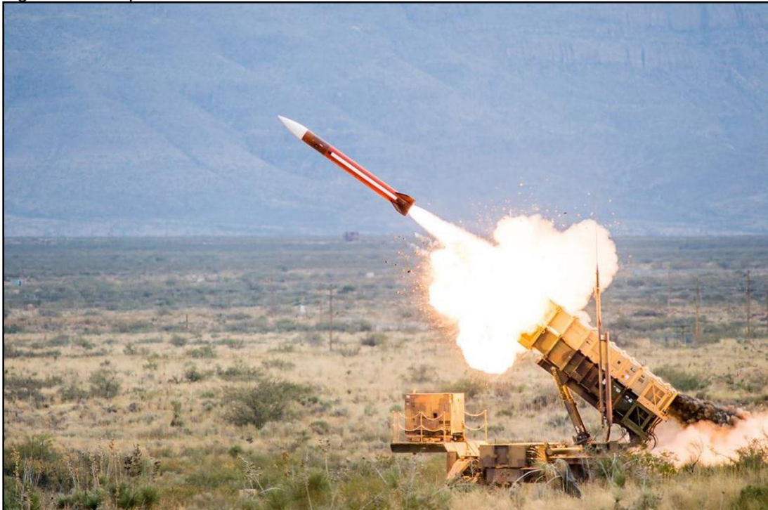
Figura 10 – Disparo do sistema de defesa aérea de mísseis Patriot .