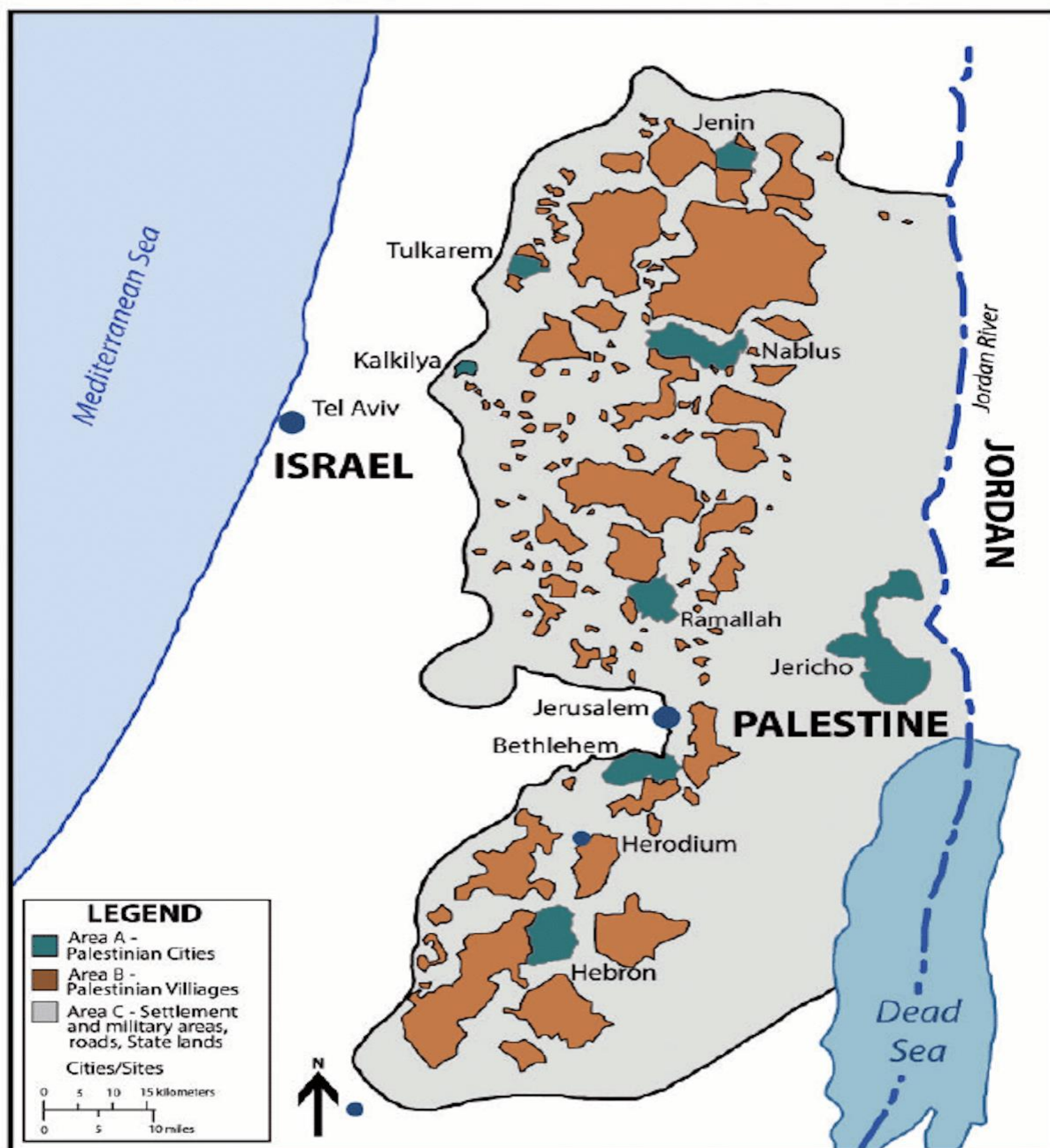
Figura 2 – Mapa dos Acordos de Oslo.