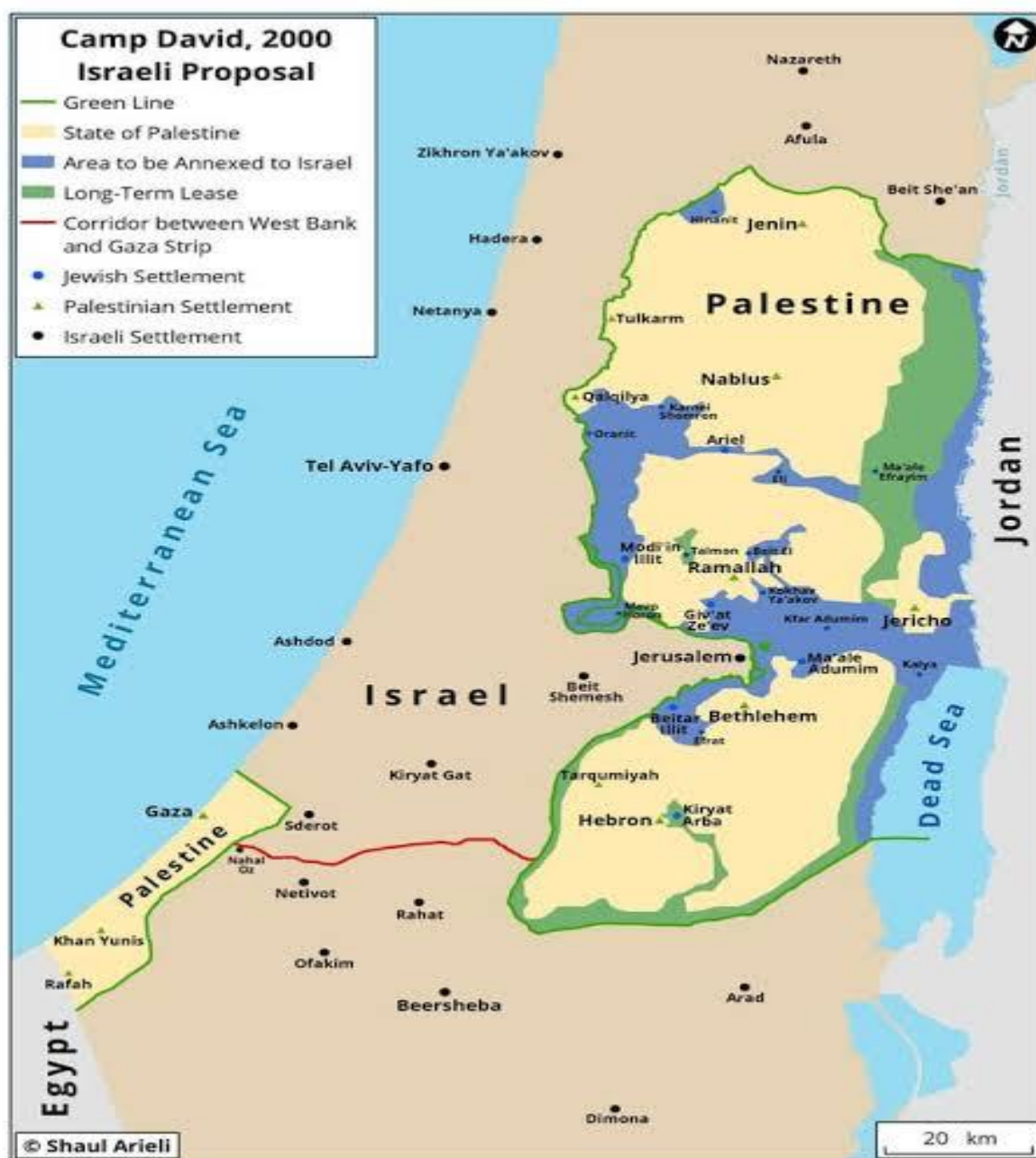
Figura 3 – Acordo de Camp David, 2000.